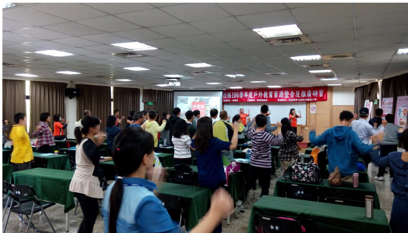
高手秀工作室老師精彩的帶動唱跳及暖身活動