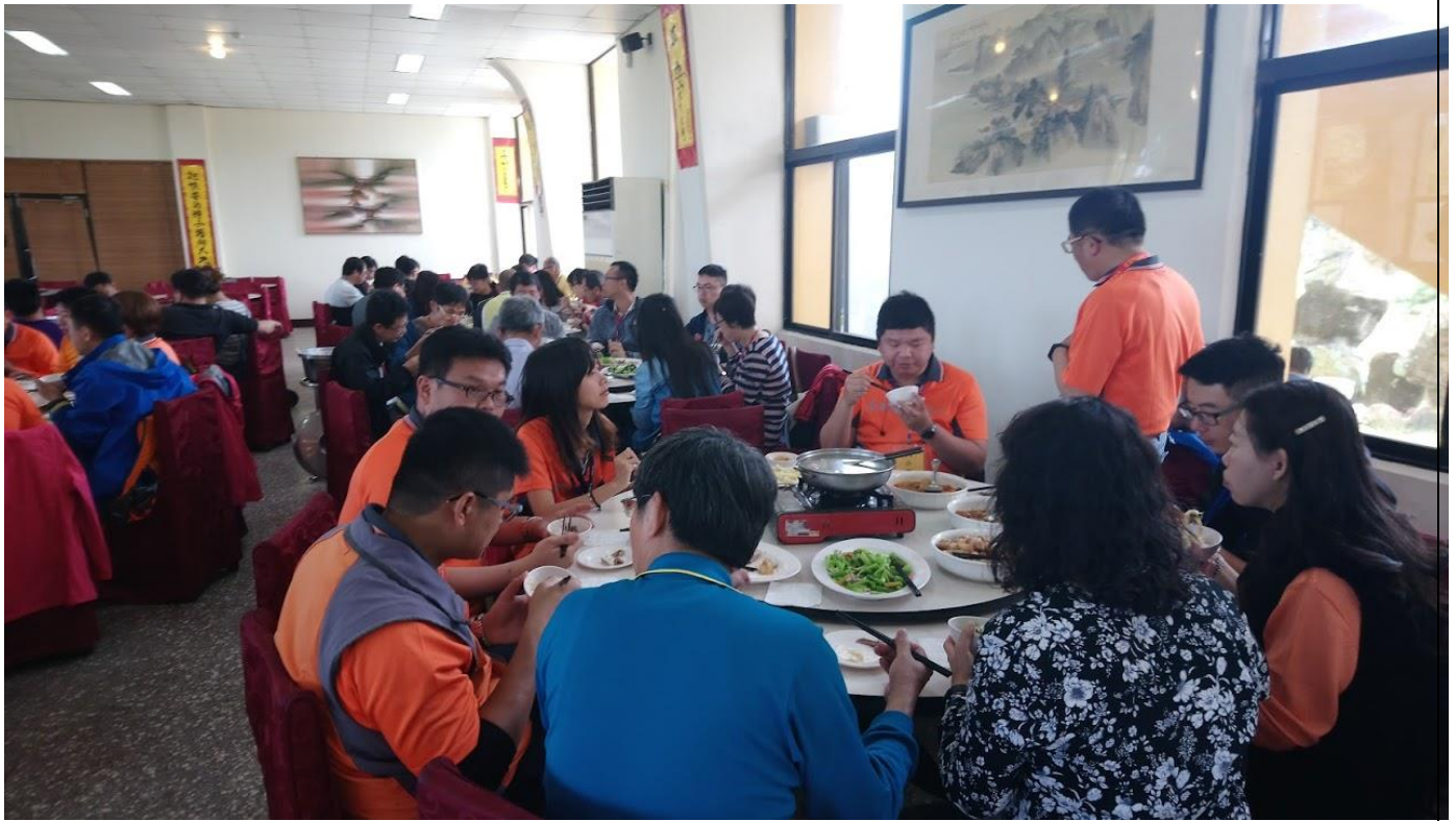
學員中午用餐情形，大家吃得津津有味準備迎接下午的課程。