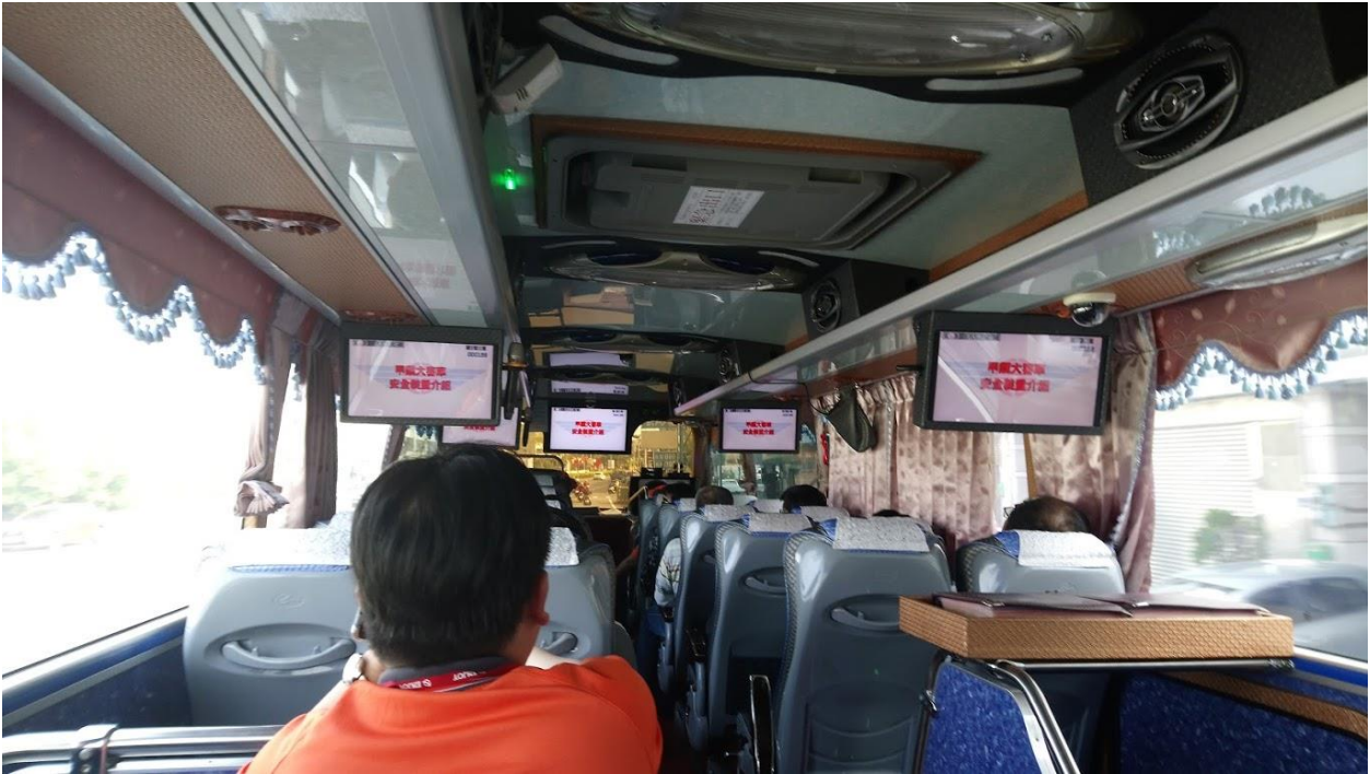
出發前在遊覽車上觀賞逃生影片及行前逃生演練