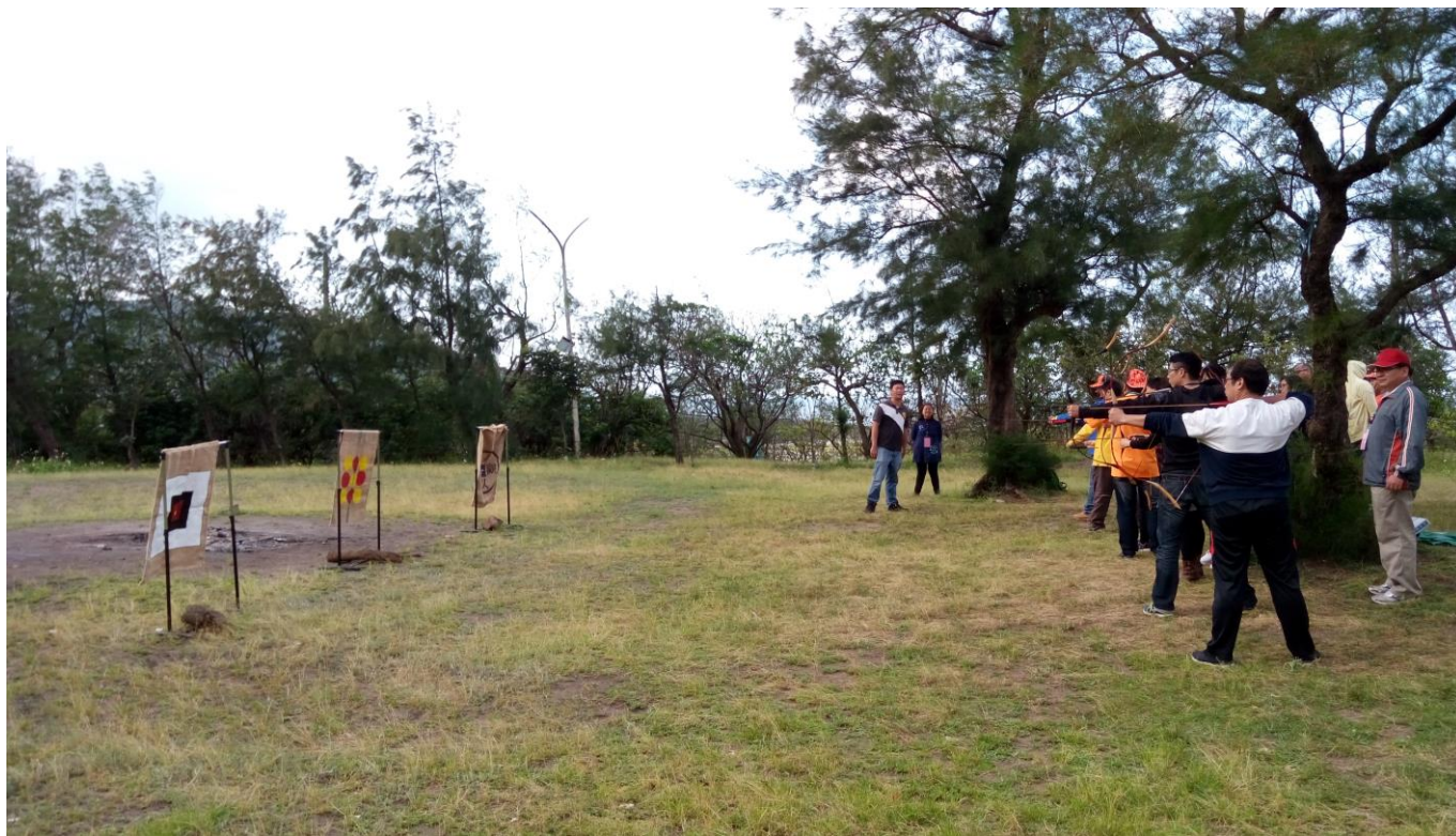
各小組進行弓箭定靶射擊活動，老師個個蓄勢待發剪影