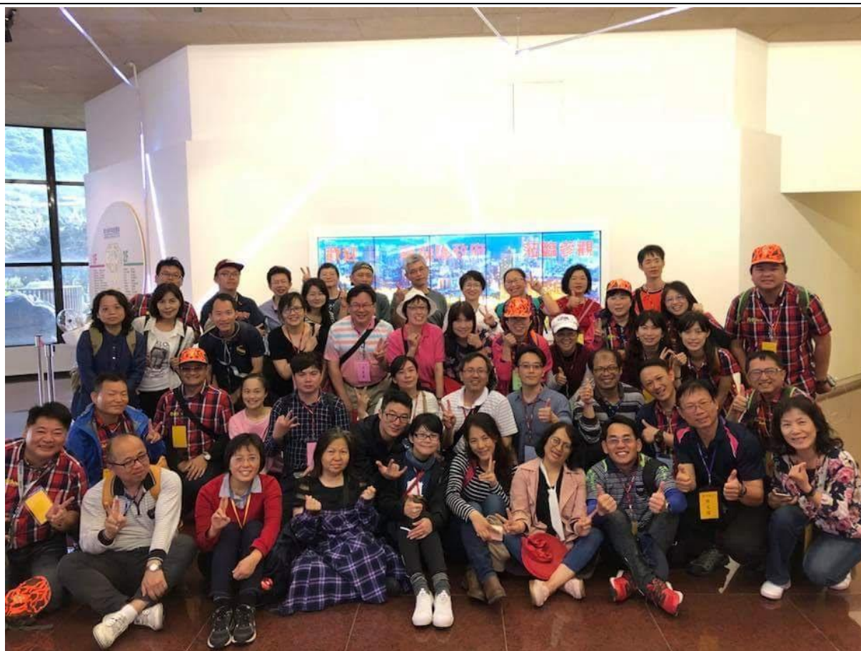
第二日安排參訪核二廠活動，老師們更加了解乾淨能源。