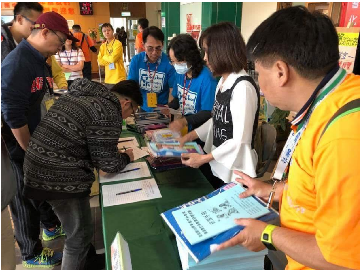
活動辦理地點及報到處：救國團金山青年活動中心