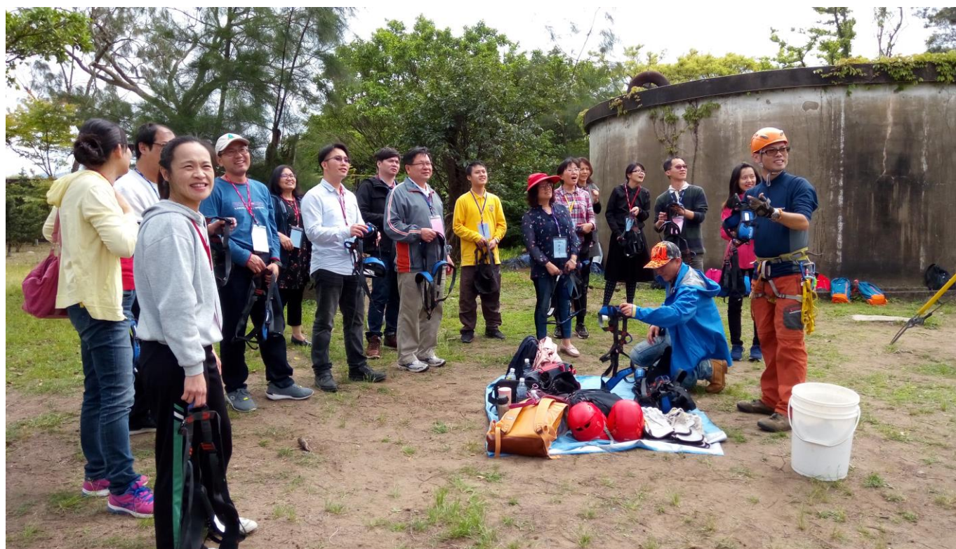
依各小隊分組進進行高空垂降體驗說明並穿戴安全裝備