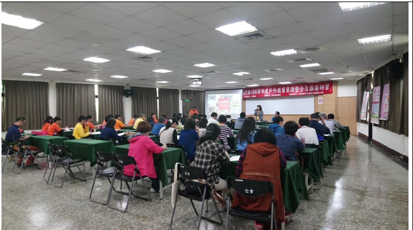
各校戶外教育承辦人員參加開幕式，專注聆聽縣府承辦人說明與介紹