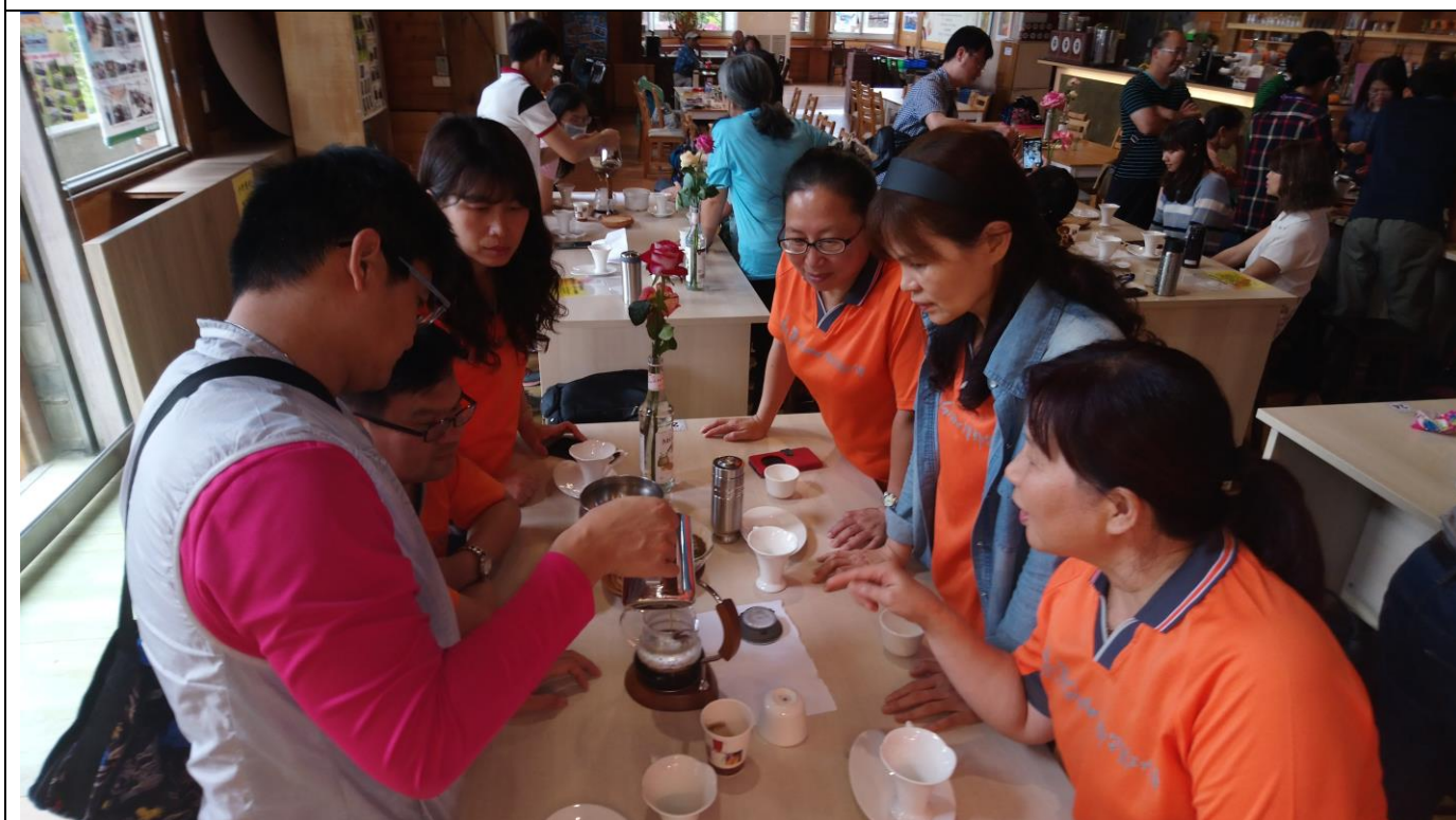
戶外體驗課程-咖啡手作沖泡教學體驗活動，學員專注學習