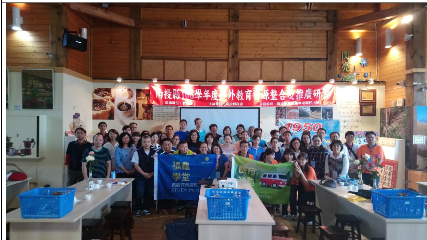
學員進行團體大合照