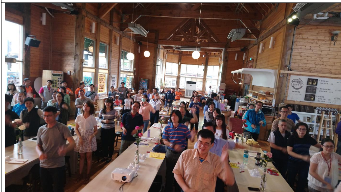
高手秀工作室老師的帶動操為整天的研習揭開序幕