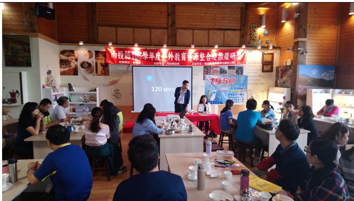
教育處 懷瑩科長進行座談會總結及勉勵