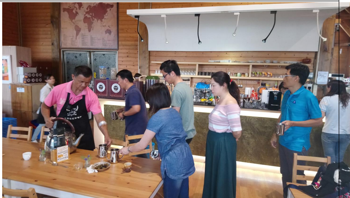
學員興致高昂且井然有序領取材料剪影。