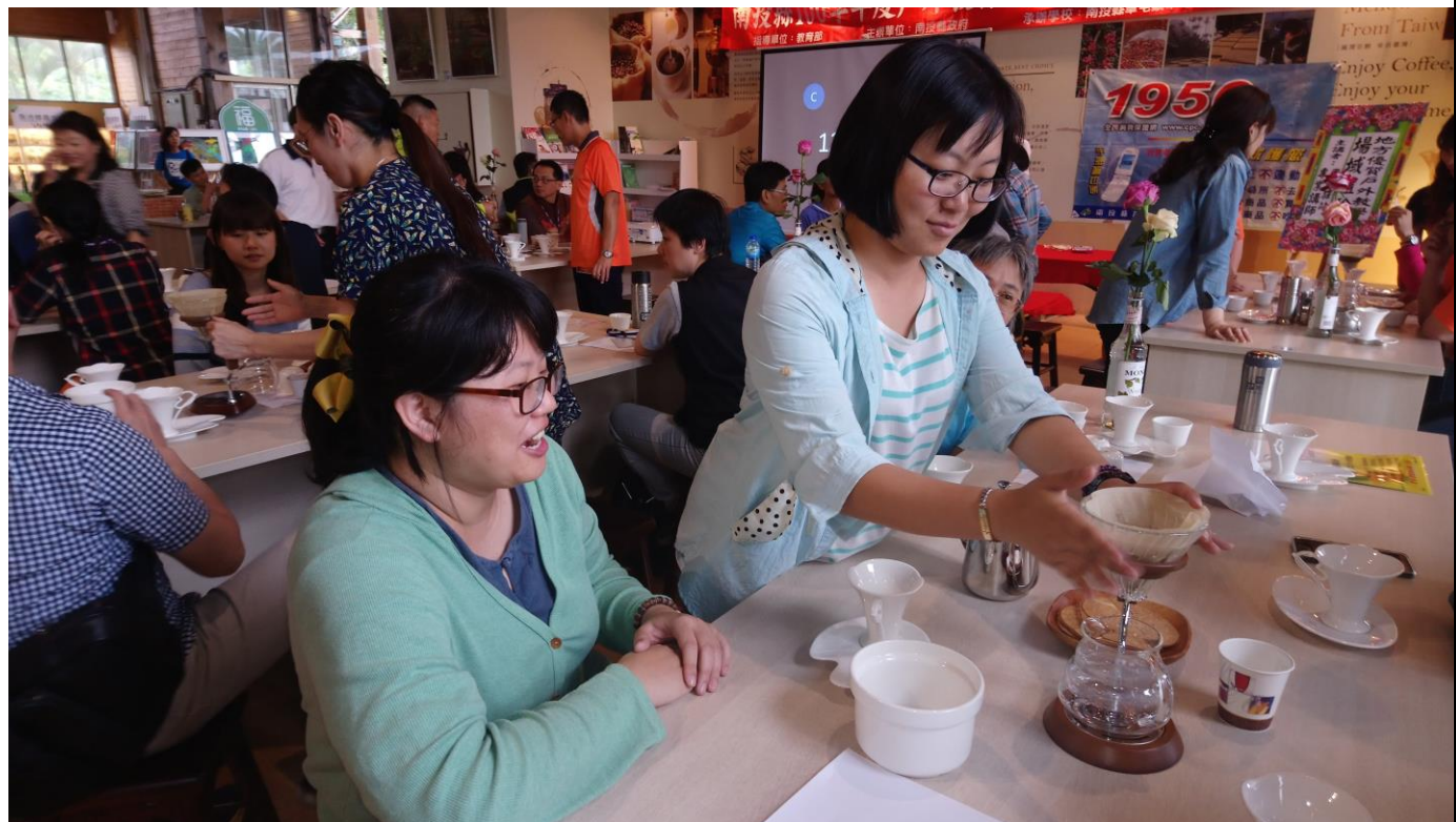
老師們親自動手沖泡並體驗學習