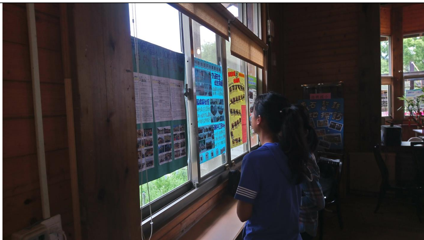
各校成果海報分享教學優良模組，提昇本縣戶外教育教學能量