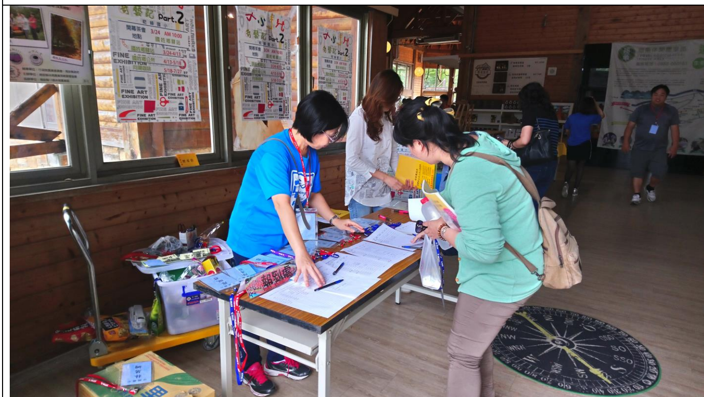
學員報到領取手冊名牌及簽到剪影