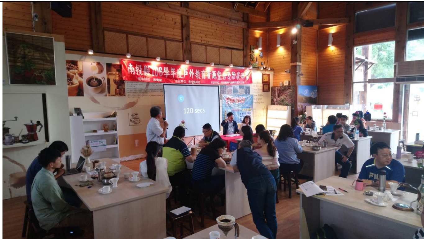
綜合座談各校承辦人進行意見交流與釋疑