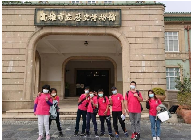
照片說明：高雄市立歷史博物館前師生合影。