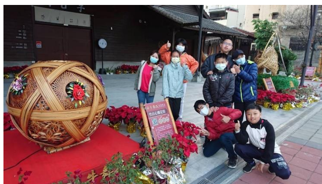
照片說明：觀賞竹山牛舞花燈會竹藝作品。