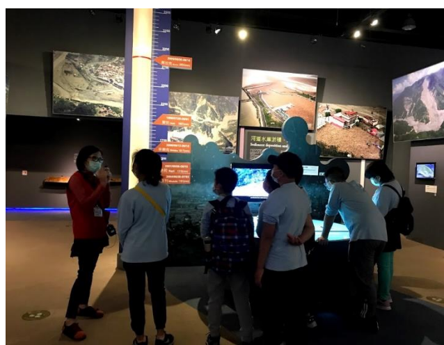
照片說明：國立科學工藝博物館導覽。