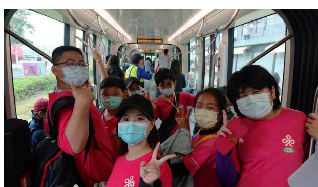
照片說明：體驗搭乘捷運。