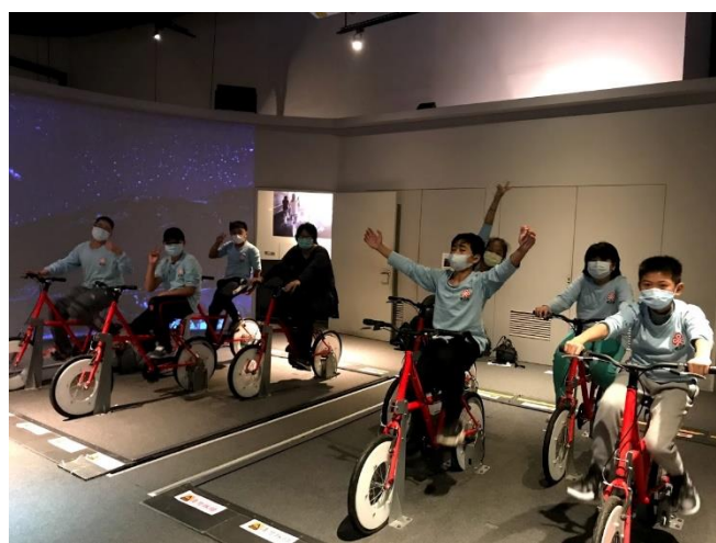
照片說明：國立科學工藝博物館體驗。