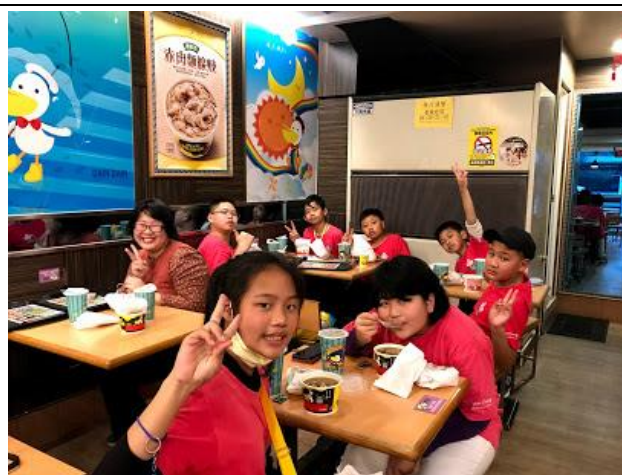
照片說明：快樂聚餐。