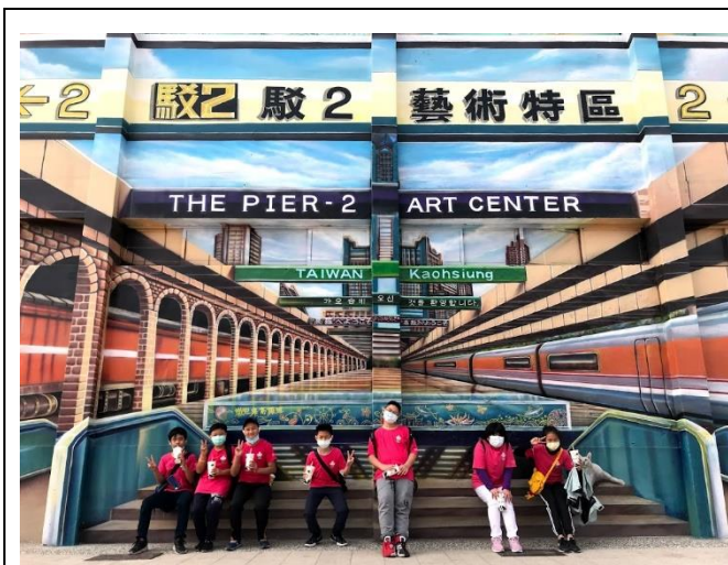
照片說明：駁二藝術特區學生合影。