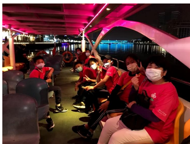
照片說明：搭乘愛之船。