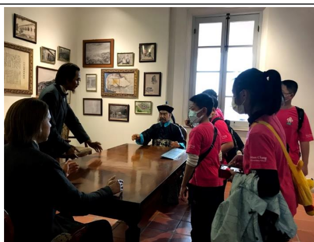
照片說明：參觀英國領事館。