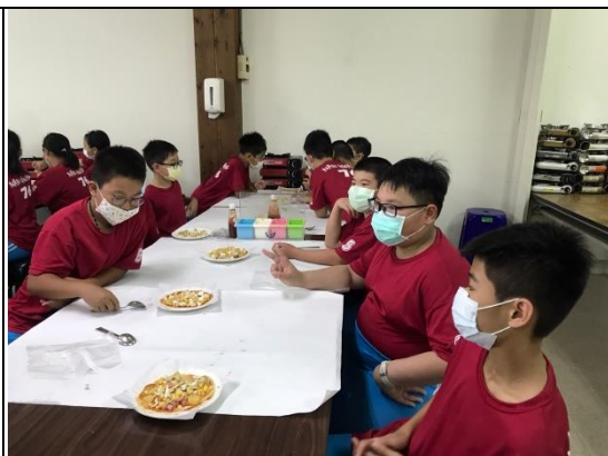
大家準備品嚐自己做的PIZZA