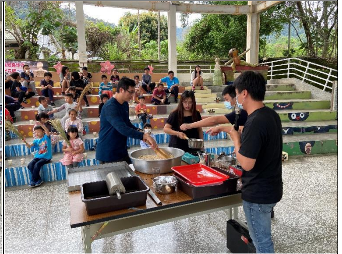
◆親師參與米樂活課程~米香製作