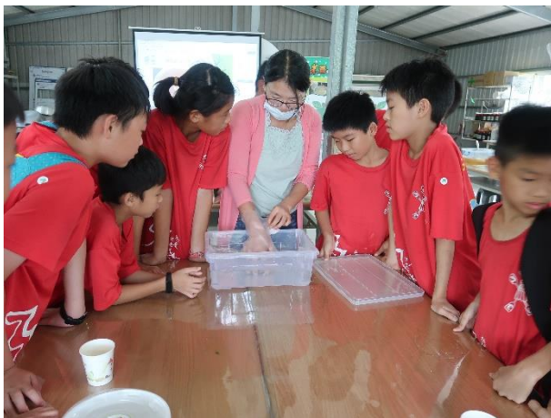
示範洗愛玉子的方式