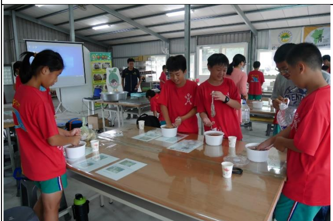
◆客庄漫遊趣~愛玉製作趣