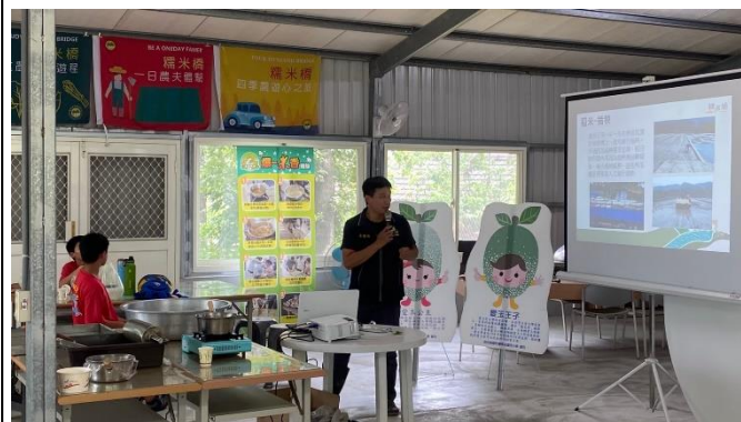
◆客庄漫遊趣~米樂活課程-冷泉米認識