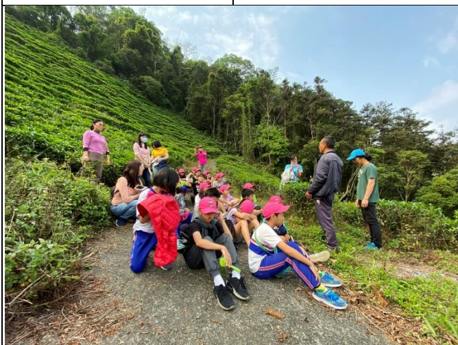
◆茶山尋香樂~五城國小