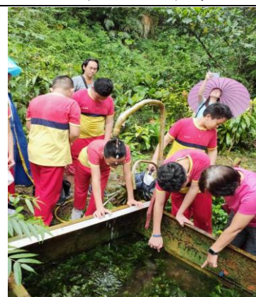
看看裡面有什麼？有蝦子唷！