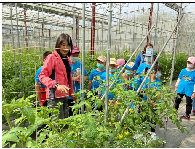
◆溫室番茄紅~史港國小