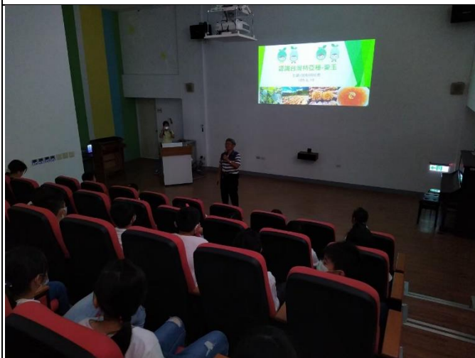
◆本校參與愛玉製作趣課程~認識愛玉