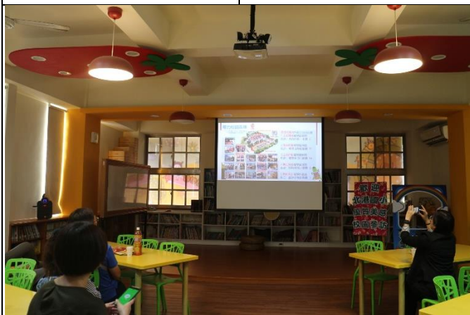
◆聽取福龜國小校訂課程計畫分享