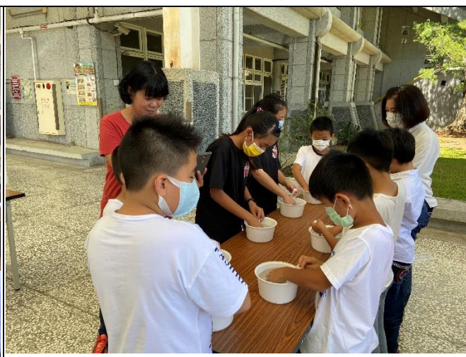
◆本校親師生一同參與愛玉實作