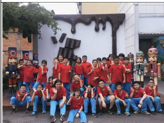
18度C巧克力工房是孩子們的最愛