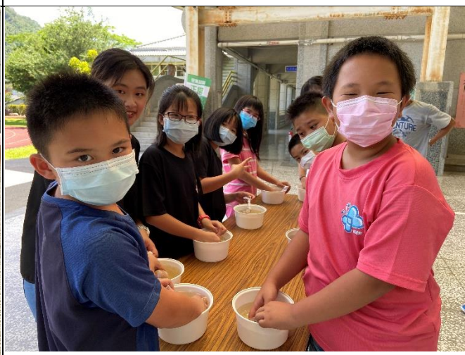
◆本校親師生一同參與愛玉實作