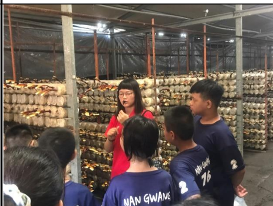
導覽課程孩子們用心聆聽學習