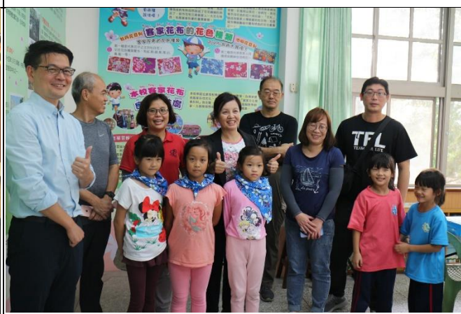
◆赴福龜國小校際共學交流參訪紀念