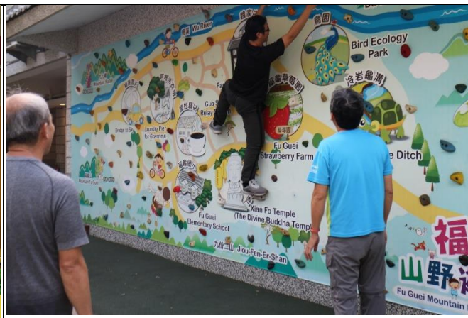
◆本校教師參與福龜國小特色課程實作