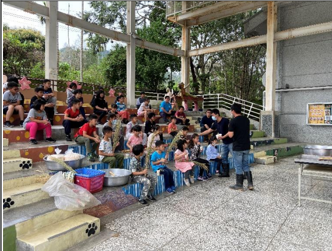
◆本校參與米樂活課程~認識冷泉米