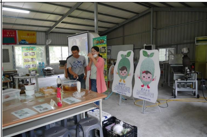
◆客庄漫遊趣~時令作物課程-認識愛玉