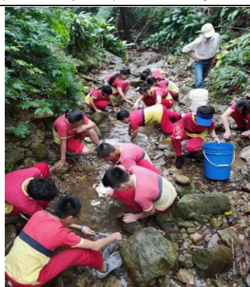
大家一起來抓溪蝦！