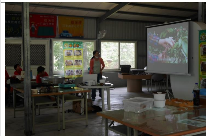
◆客庄漫遊趣~時令作物課程-認識愛玉