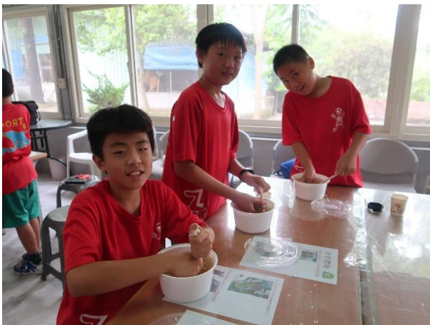
動手體驗洗愛玉子