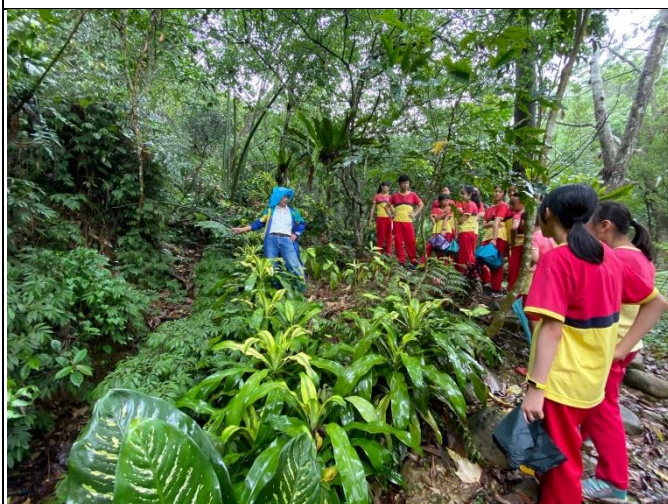
◆原文化踏查~愛蘭國小