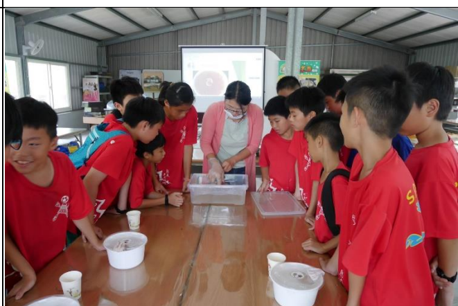
◆客庄漫遊趣~愛玉製作趣