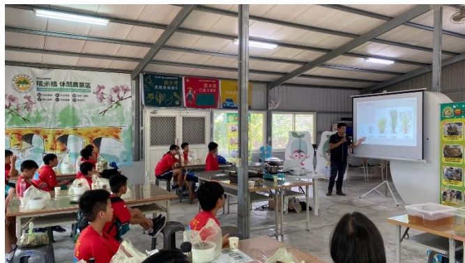
◆客庄漫遊趣~米樂活課程-冷泉米認識