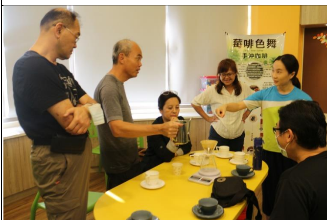
◆本校教師參與福龜國小特色課程實作