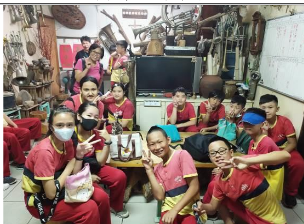
長老的家--長老說故事囉！