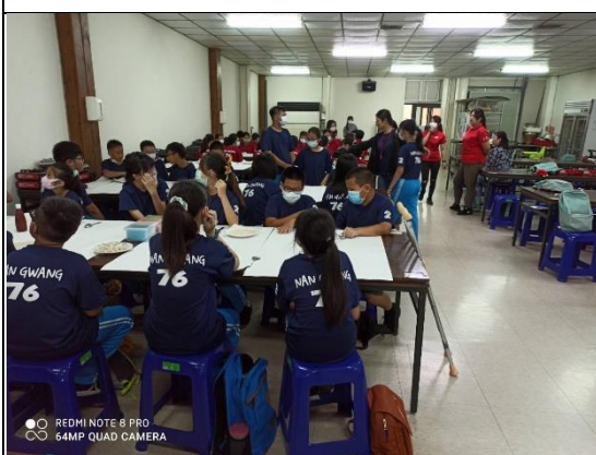
大家安靜有序地製作PIZZA