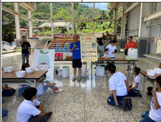
◆本校參與愛玉製作趣課程~認識愛玉