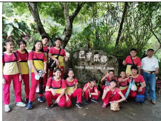
戶外教學-巴宰原鄉之旅