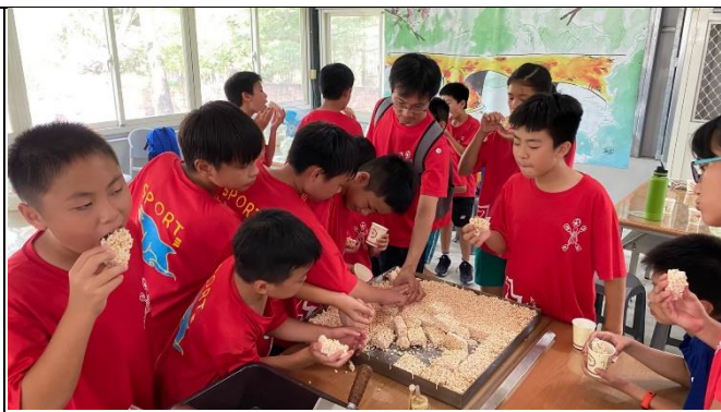
◆客庄漫遊趣~米樂活課程-米香 DIY