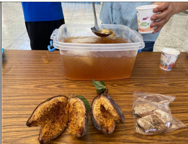
◆本校參與愛玉製作趣課程~認識愛玉