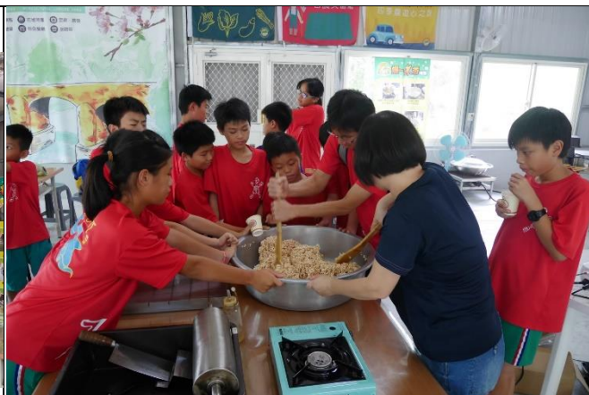
◆客庄漫遊趣~米樂活課程-米香 DIY