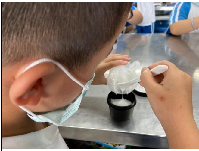
◆認識皂質植物•親手乳 DIY ~草屯國小