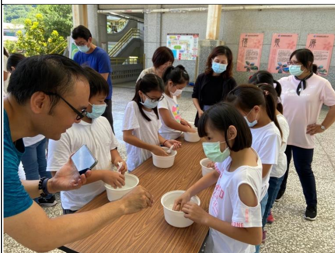
◆本校親師生一同參與愛玉實作