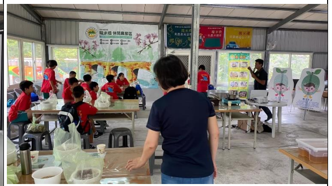
◆客庄漫遊趣~米樂活課程-冷泉米認識