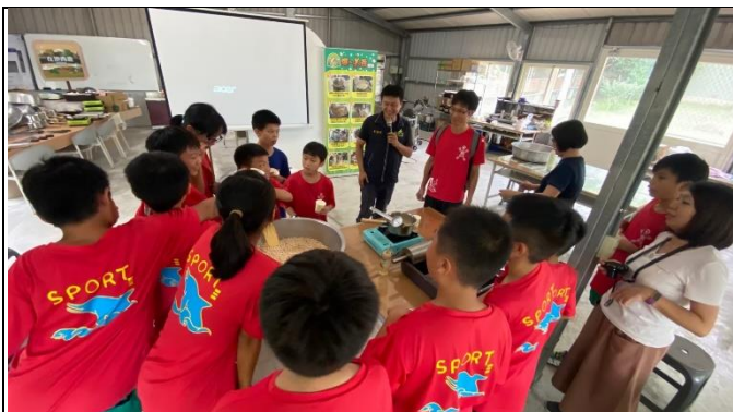
◆客庄漫遊趣~米樂活課程-米香 DIY