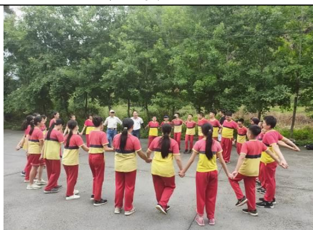
巴宰族歌謠與舞蹈練習