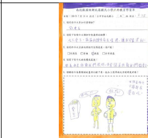
◆客庄漫遊趣~學生學習紀錄