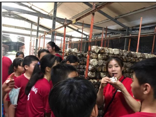
導覽老師用心且專業的解說菇類的成長