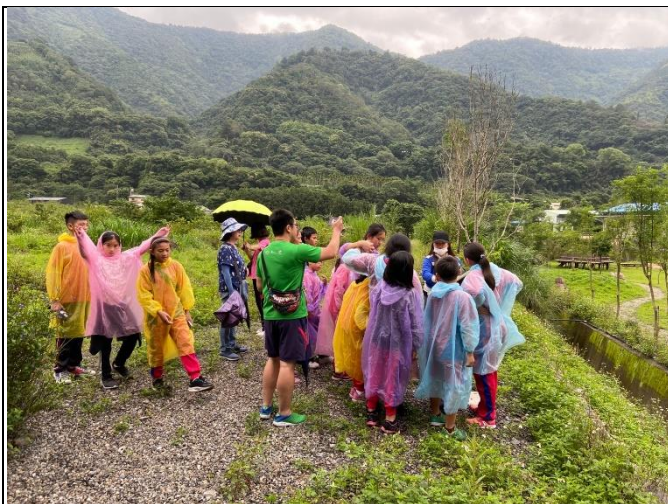
◆蝴蝶家探源~南豐國小