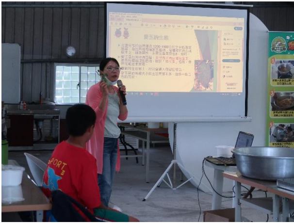
簡報說明愛玉子的生態介紹

做的活動可以讓學生對於活動的印象更加深刻。 (二)在與地方產業結合的介紹是一個很成功的活動，若是能增加實地的探訪，認識稻米的生長環境，更可以讓學生感受稻米生態與自然相互結合的最佳案例。