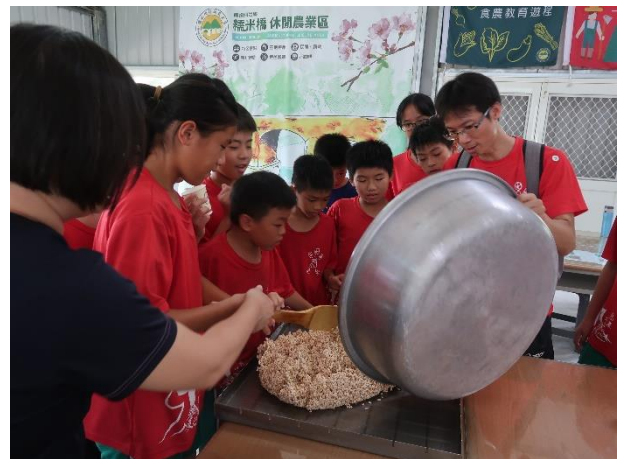
學生體驗爆米香的製作