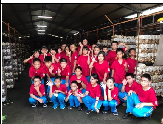
參觀完農場後一起合影