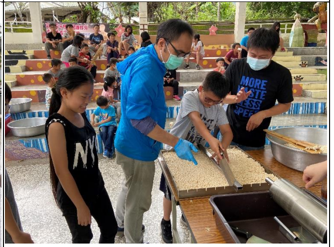
◆學生參與米樂活課程~米香製作