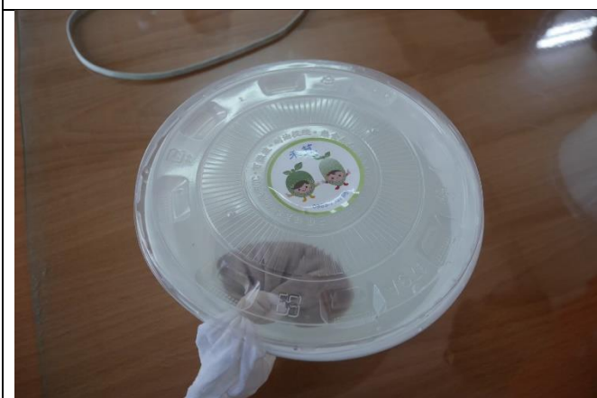
◆客庄漫遊趣~愛玉製作趣