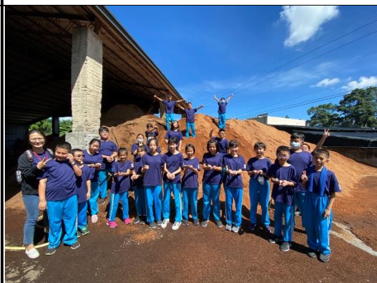
第一次我們近距離看木屑山好新鮮喔