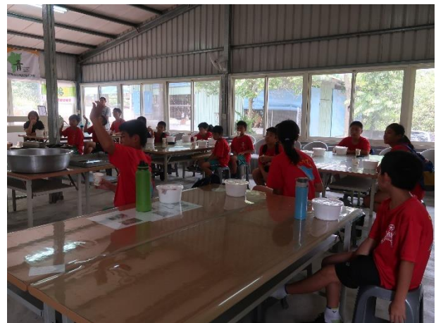
學生針對問題提問