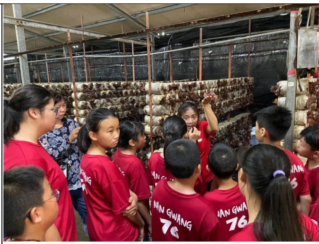
◆科技好「菇」事~南光國小