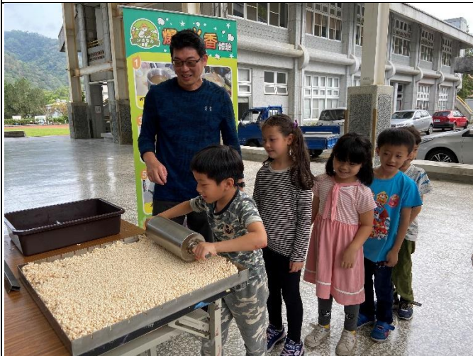
◆學生參與米樂活課程~米香製作