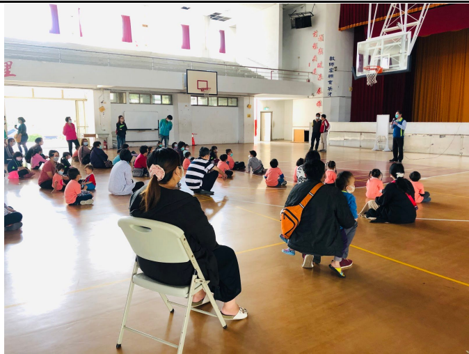
大成國中活動前說明