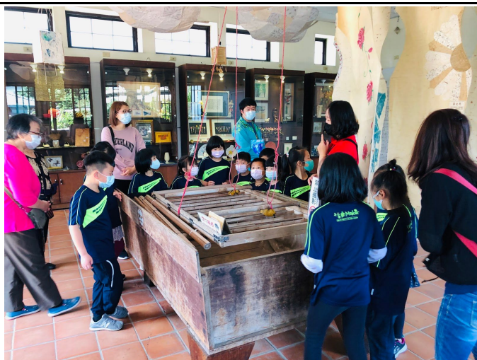
活動課程二：紙的歷史