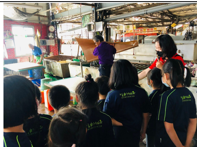
活動課程四：造紙流程