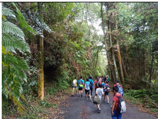
3. 學生進行貓嘯山學習體驗課程