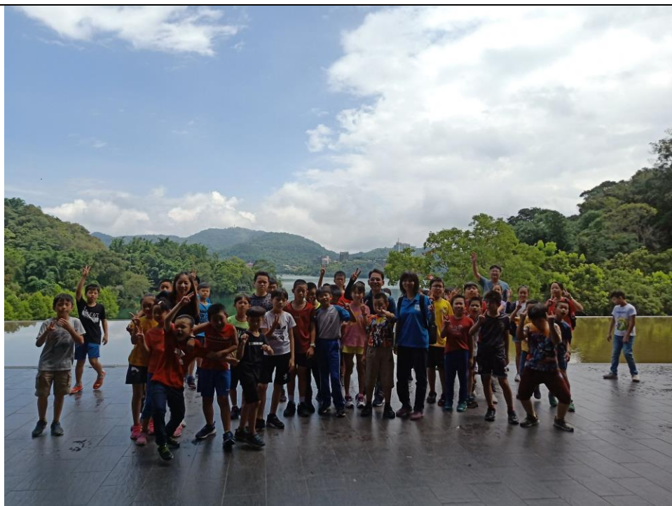
7. 學生進行向山遊客中心學習課程合影