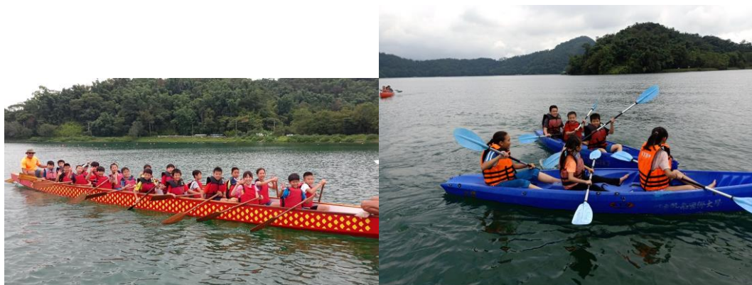
9. 學生進行海洋學習課程