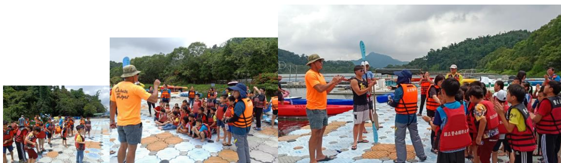
8. 學生進行月牙灣水上學習課程