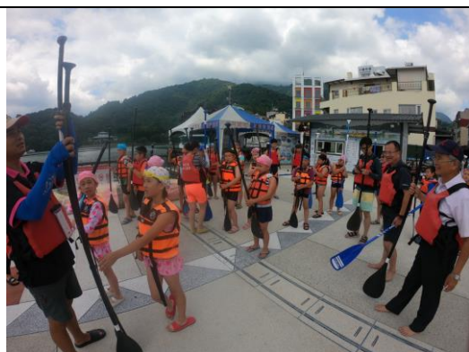
說明：「SUP 立槳」操作解說