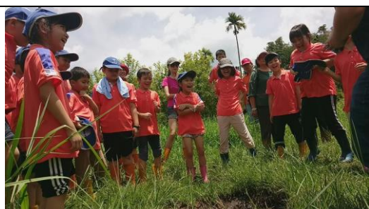
說明：泥炭土活盆地體驗-曼波田