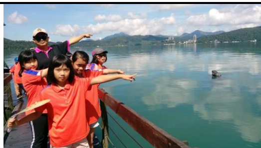
說明：水蛙頭步道-九蛙疊像