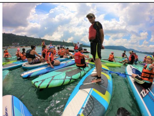
說明：「SUP 立槳」體驗-個人