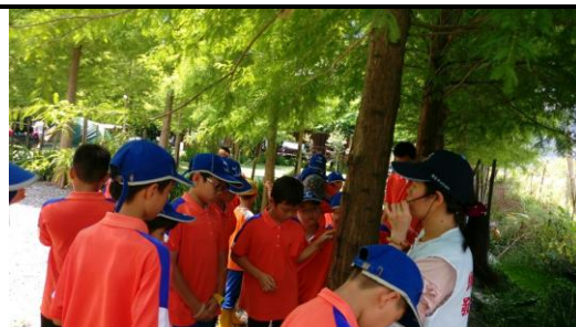
說明：泥炭土活盆地生態介紹