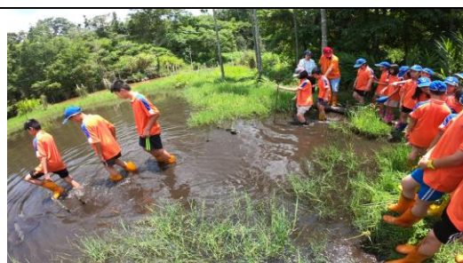
說明：泥炭土活盆地-木棧道