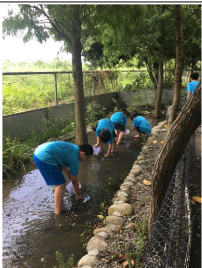
說明：探索活動-摸蜆仔