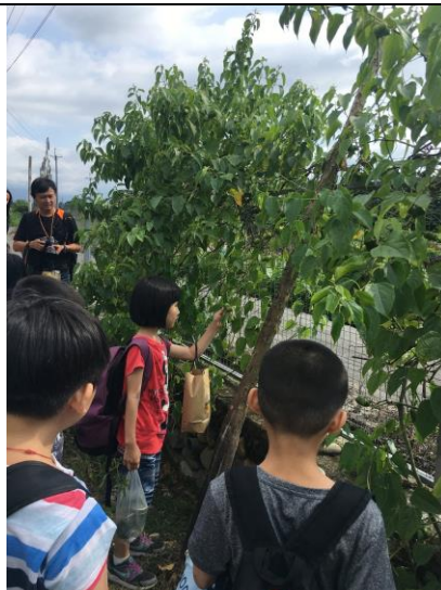
說明：探索活動內容-認識園區的多種植物