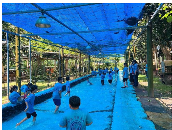
說明：探索活動說明-戲水池