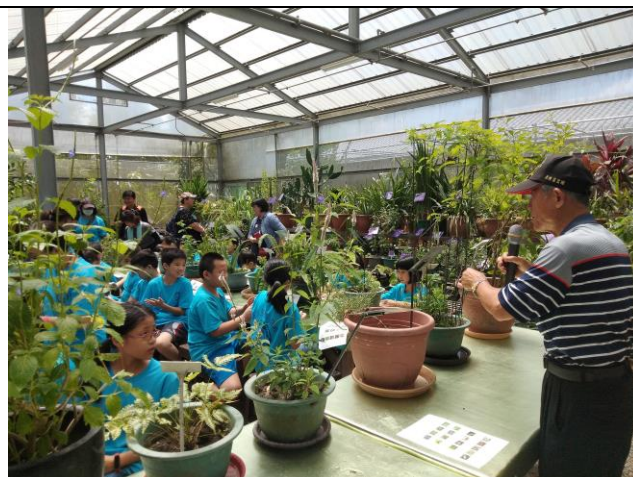
說明：植物導覽解說+水族瓶魚菜共生 DIY