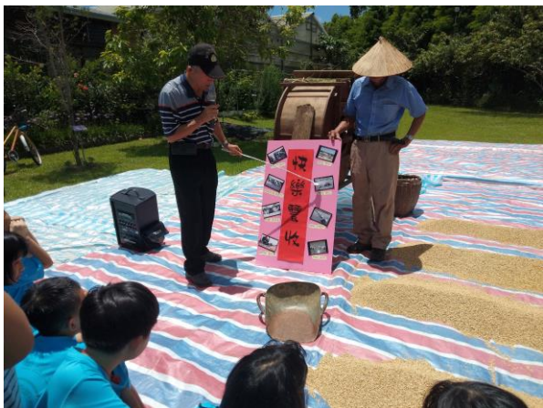
說明：體驗農村稻埕的曬穀及操作脫穀機