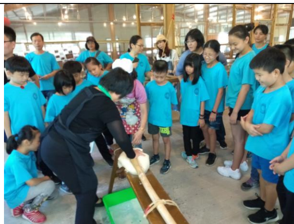
說明：體驗活動導覽解說+在地食材 DIY