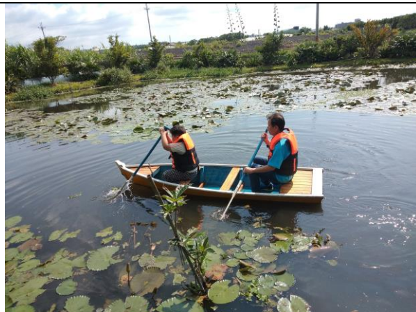
說明：探索活動內容-划船