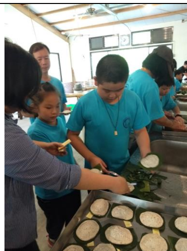
說明：在地食材〈草仔粿〉DIY