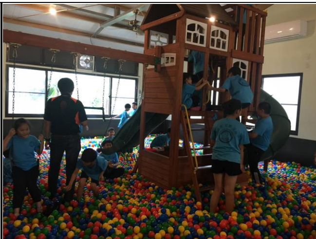
說明：探索活動內容-球池