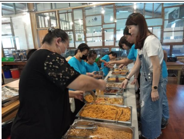
說明：在地食材風味餐。