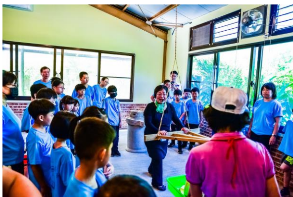
說明：體驗活動導覽解說+在地食材 DIY