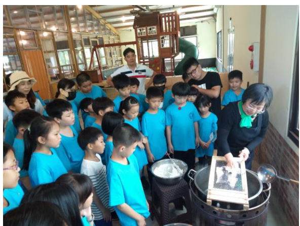
說明：在地食材〈米苔目〉DIY