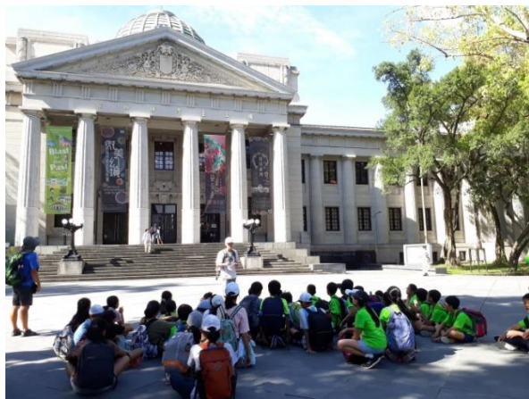
共同行程—台灣博物館