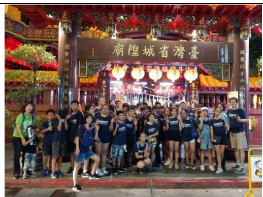
共同行程—台北府城隍廟