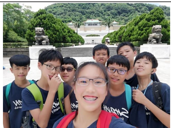
分組自主行程-深入學習