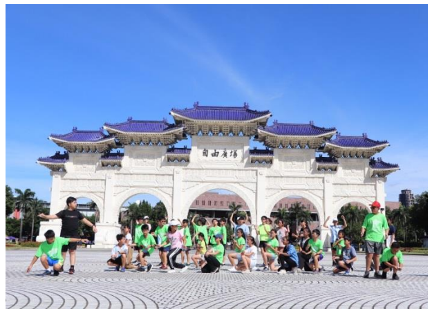
共同行程—自由廣場