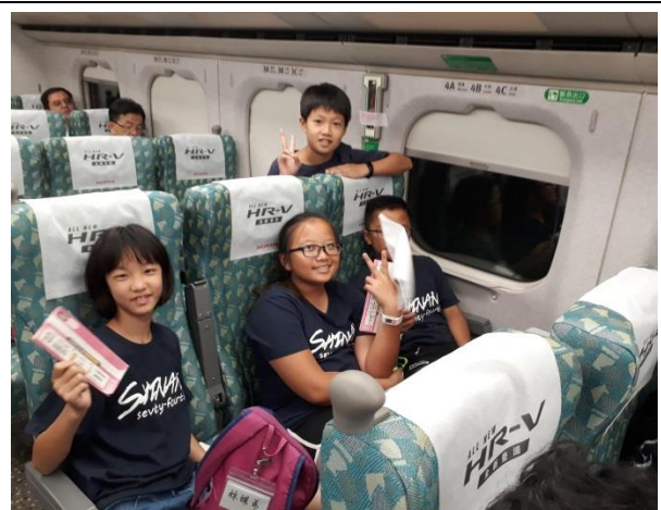
分組自主行程-回埔里