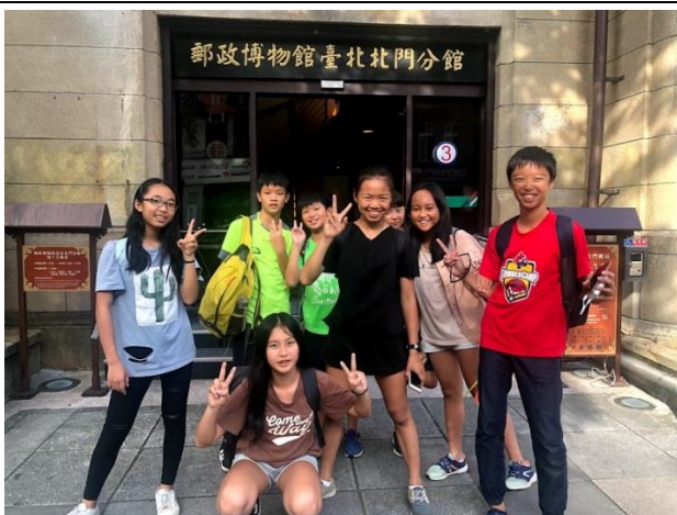
分組自主行程-深入學習