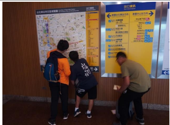
問題解決:迷路狀況處理