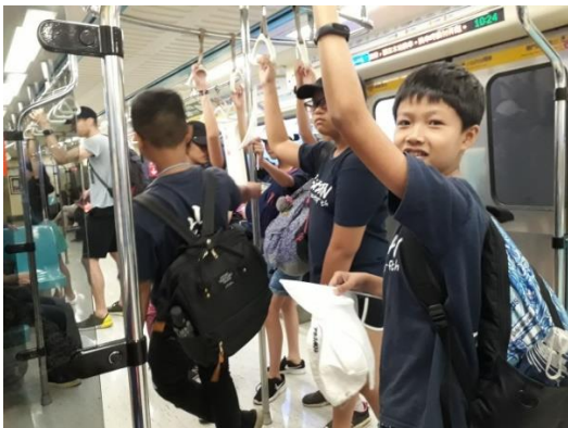
轉搭捷運-挑戰開始