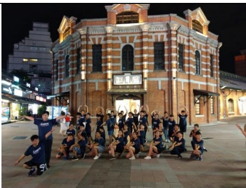
共同行程—西門紅樓