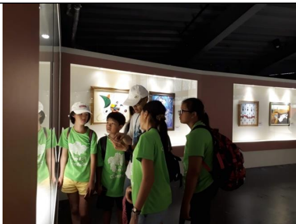
分組自主行程-深入學習