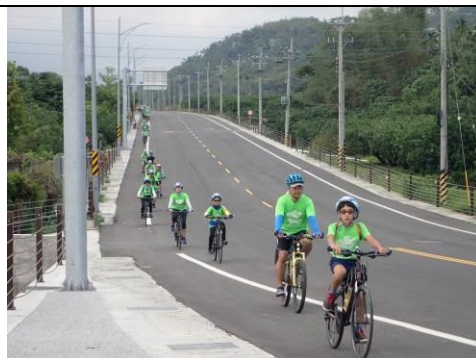
馳騁在 193 縣