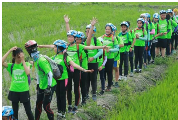
田野中的千手觀音