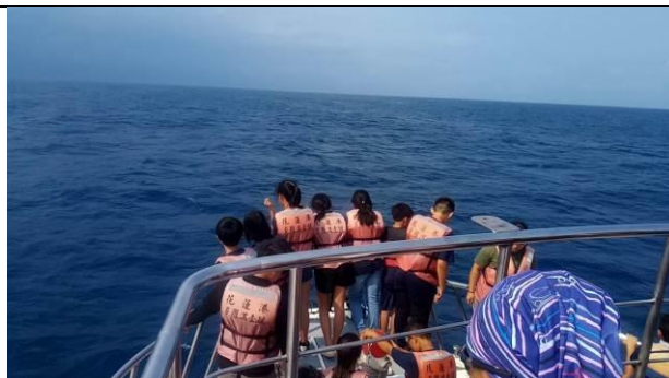
一望無際的太平洋