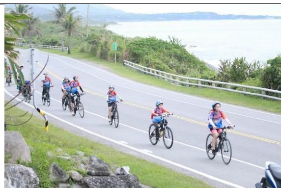
遨遊台 11 縣