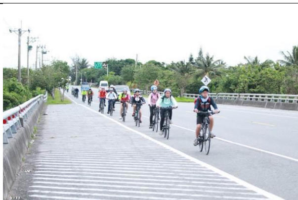
台 11 線上