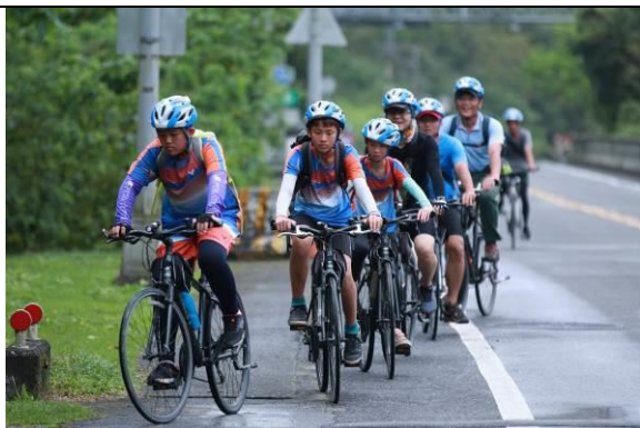
奮力騎上玉長公路