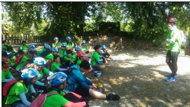
林田神社的過往今來