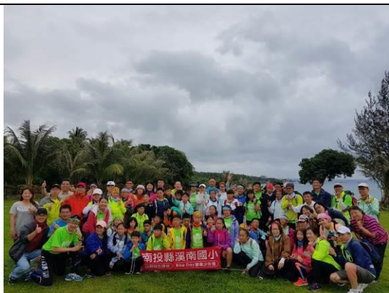
離開麒麟部落營區