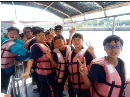
搭上賞鯨船出發了