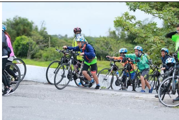
大隊快速通過馬路