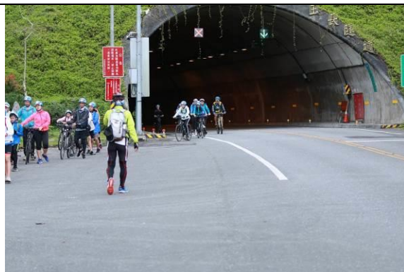
全體通過玉長隧道