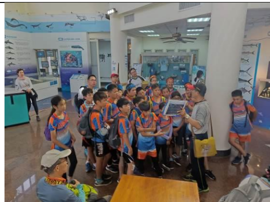
海洋環境教室上課