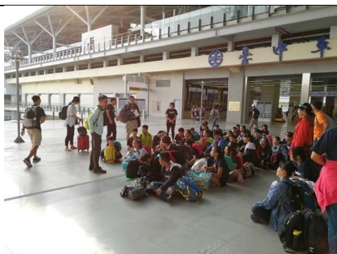
台中火車站校長勉勵