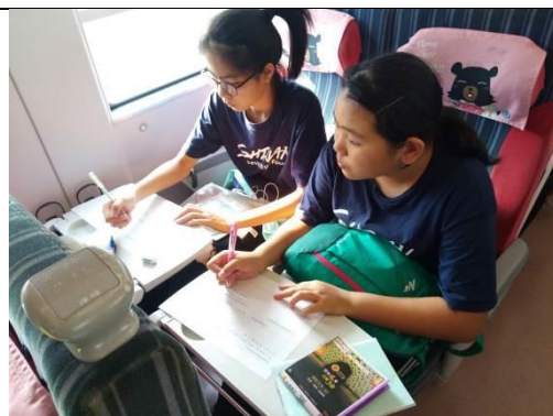
普悠瑪號上課程進行