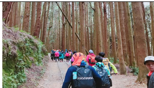
山野教育-特富野古道尋禮