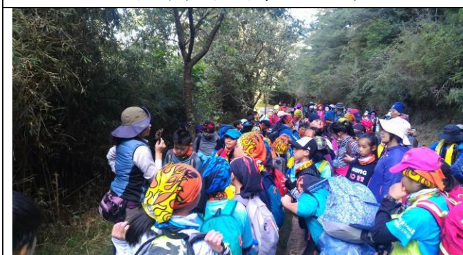
塔塔加步道-解說員生態解說