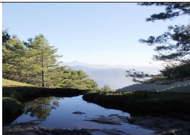
生態教育課程-鹿林山動物棲息地觀察