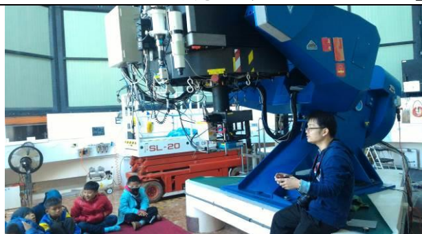
生態教育課程-鹿林天文台參訪