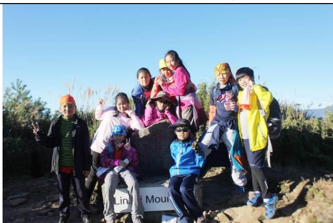
山野教育-鹿林山攻頂成功合影