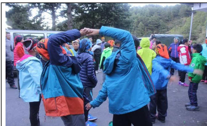
出發前準備-暖身運動體操