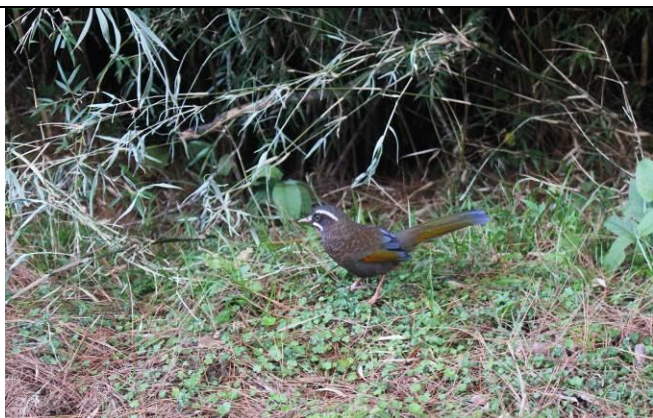
生態教育課程-鹿林山動物棲息地觀察