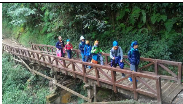
山野教育-特富野古道百年老橋