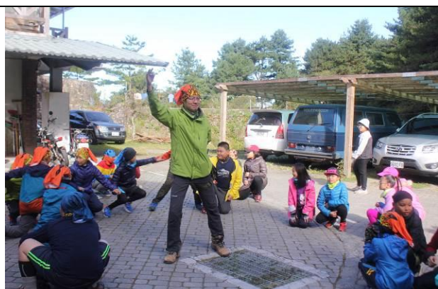
出發前準備-暖身運動團康活動