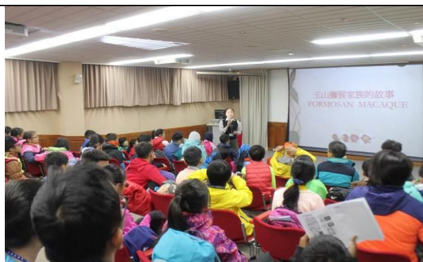
塔塔加遊客中心-導覽員簡介「猴你在一起」