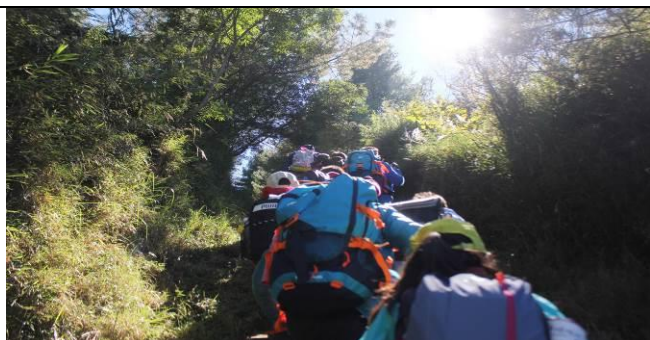
山野教育-尋訪鹿林山步道