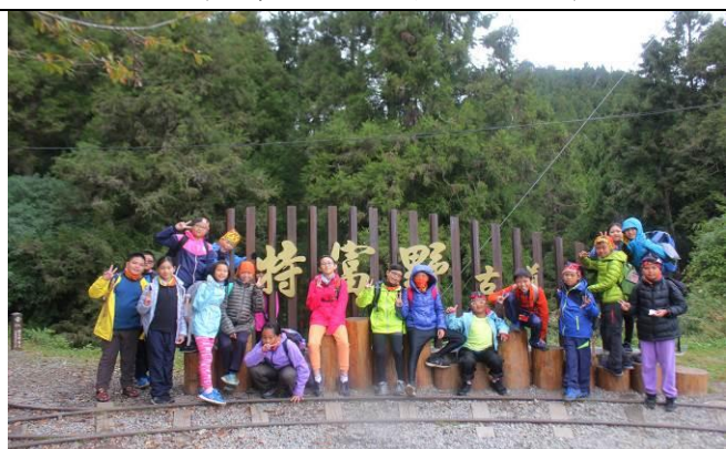
山野教育-特富野古道入口合影