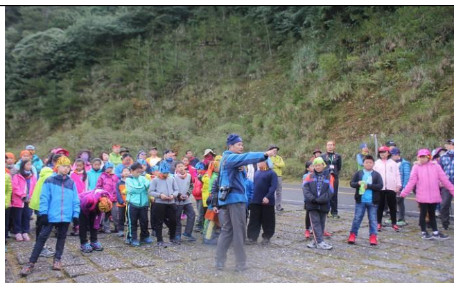
生態教育-石山獼猴生態解說