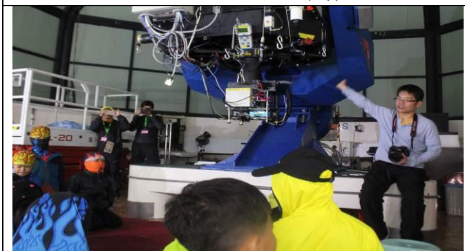
生態教育-鹿林天文解說