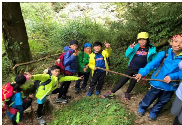
山野教育-麟趾山步道尋禮