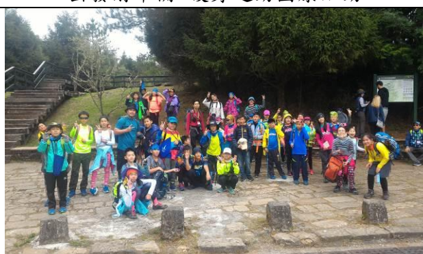
塔塔加-遊客中心合影留念