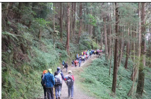
山野教育-特富野古道尋禮