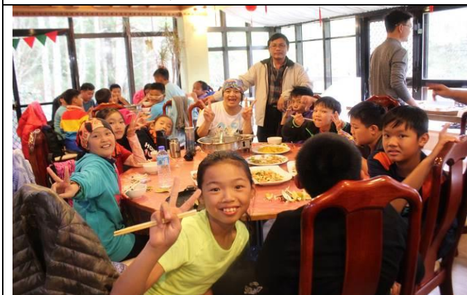
塔塔加-遊客中心午餐