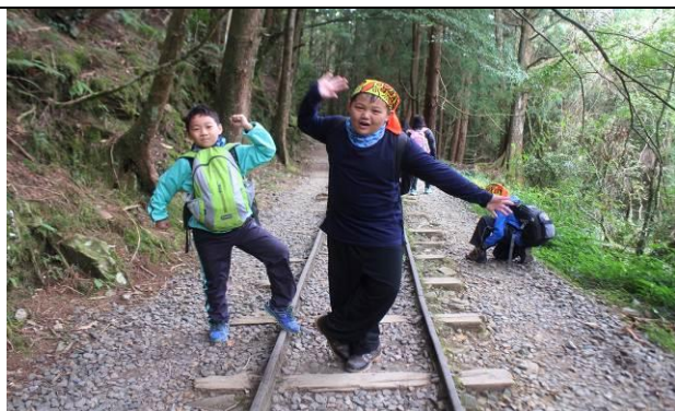
山野教育-特富野古道尋禮