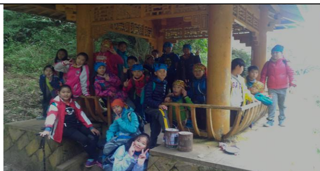
山野教育-特富野古道涼亭合影