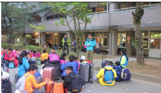
行前教育-溪南國小出發前校長的叮嚀