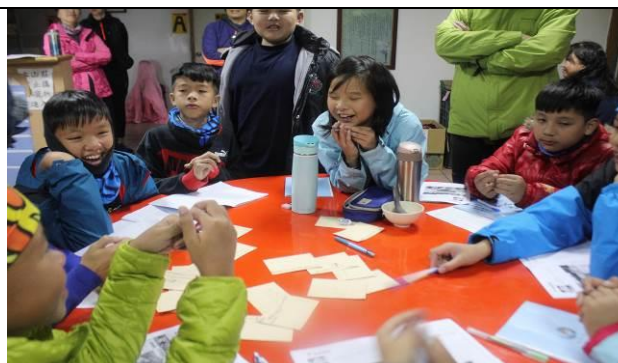
東埔山莊-夜間心得分享