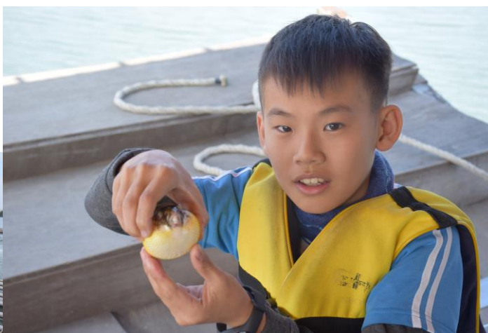
9. 學生參訪台江國家公園進行海洋自主學習課程