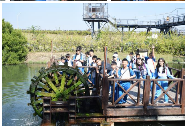
7. 學生進行德記洋行-安平樹屋學習課程