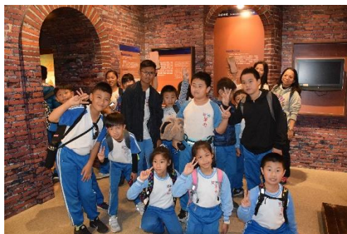
6. 學生進行自主學習課程(熱蘭遮城博物館)