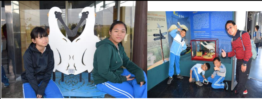
10. 學生參訪黑面琵鷺保護區進行海洋自主學習課程