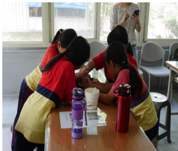
照片內容說明:北港國小學生擂茶