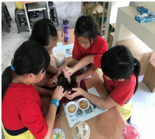
照片內容說明:一起合作擂茶