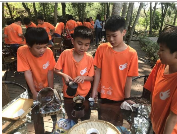
照片內容說明:動手沖泡咖啡