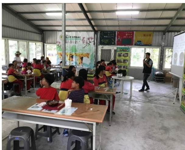
照片內容說明:與愛蘭國小一起上擂茶客

學習內容：講述擂茶，是從東漢時代到現代的演變，介紹擂茶器具，「擂棍」、「擂鉢」，擂棍的材質要選無毒木材，基本上都是使用芭樂樹和苦茶油粗的樹枝當擂棍，擂鉢內要有放射型的線條才能使用，擂茶的時候要從好擂的食物先下去研磨再慢慢加其它比較硬的食材下去擂，研磨的順序才是關鍵