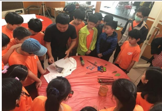
照片內容說明:葉拓 T-Shirt 教學