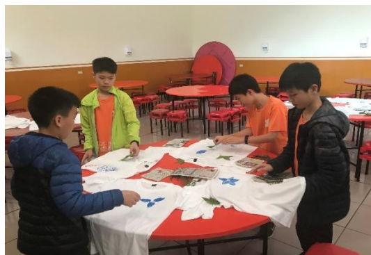
照片內容說明:創作葉拓 T-Shirt