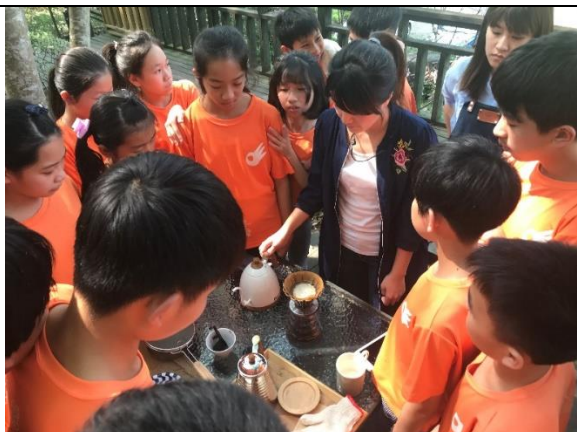
照片內容說明:咖啡解說烘豆、手沖教學