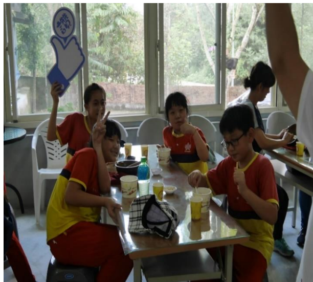
照片內容說明:愛蘭國小學生品嚐擂茶