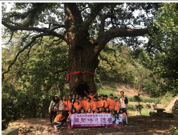
照片內容說明:茄苳神木導覽解說