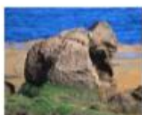
• 地球石 •