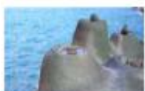
• 仙女鞋 •