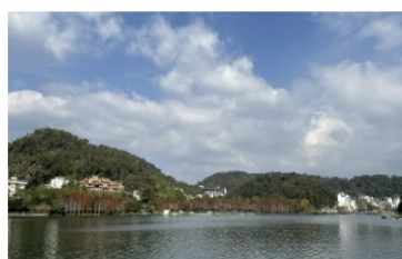
北旦碼頭水面平靜，適合立槳活動的安全水域