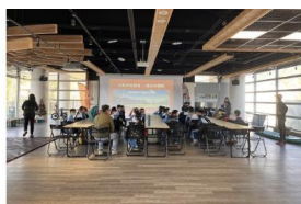
onelif日月潭戶外運動專家室內團