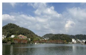
日月潭大自然景觀