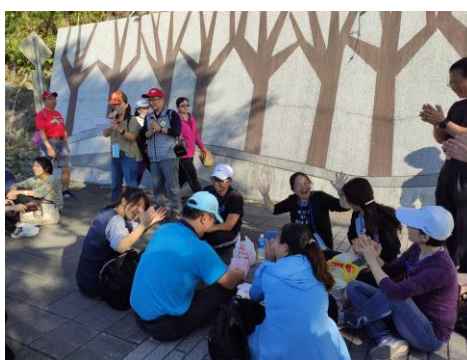
15. 學員進行定向體驗分享