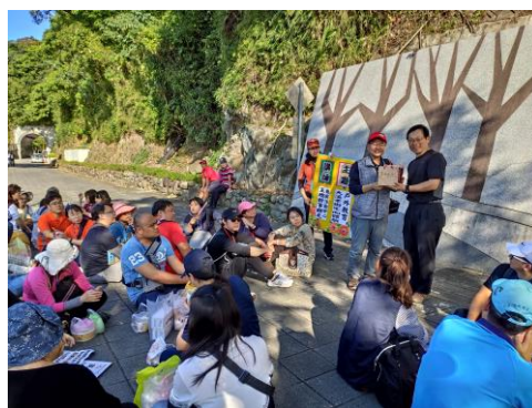
13. 大溪老街定向體驗