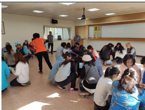
9. 學員進行探索體育體驗課程