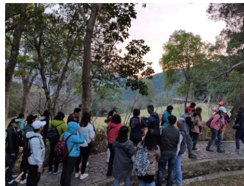
5. 學員進行分組角板山走讀列車、自然體驗課程