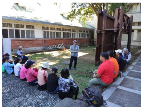
12. 學員進行探索體育體驗課程(高牆)