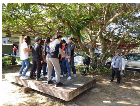
10. 學員進行探索體育體驗課程(賞鯨船)