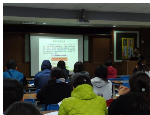
6. 十二年國教自然體驗、角板山走讀與定向活動教案分享說明