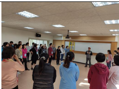
8. 學員進行探索體育體驗課程