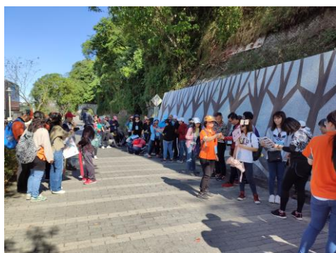
14. 大溪老街定向體驗分組