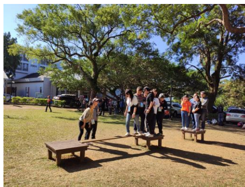
11. 學員進行探索體育體驗課程(跳島)