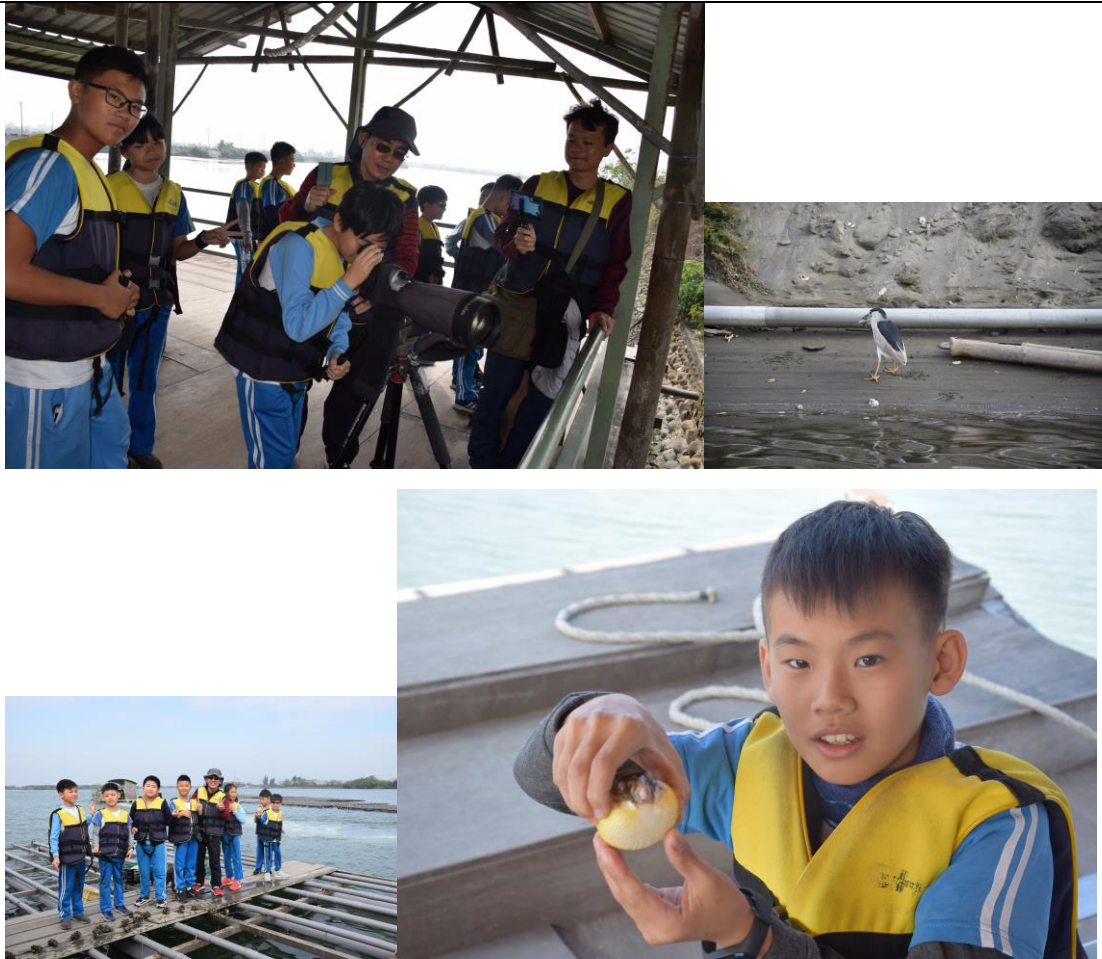
9. 學生參訪台江國家公園進行海洋自主學習課程