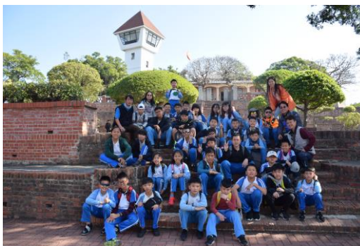
4. 學生進行自主學習課程(安平古堡)