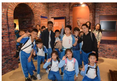
6. 學生進行自主學習課程(熱蘭遮城博物館)