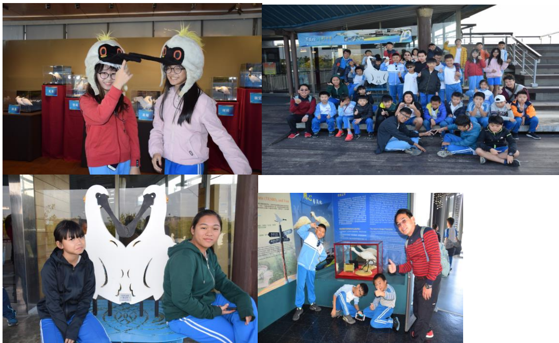
10. 學生參訪黑面琵鷺保護區進行海洋自主學習課程