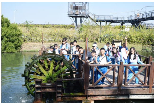
7. 學生進行德記洋行-安平樹屋學習課程