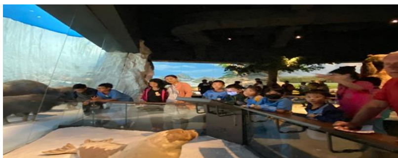
照片說明：「四草湖」豐富的動、植物生態