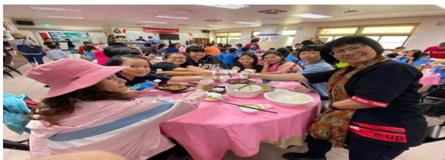
照片說明：快樂聚餐