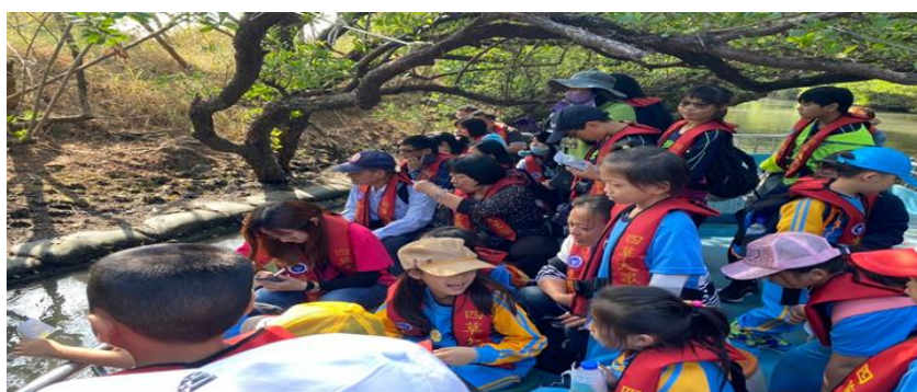
照片說明：「台江國家公園」自然園區導覽