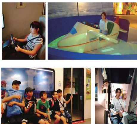
畢業旅行 科工館報告製作

第一天我們在故宮南院內看到了許多關於佛和樂高，左上角那一張照片就是故宮的建築物，右上方的肉形石是特定的展覽，旁邊這一張是最早以前的彌勒佛，這一次去故宮南院讓我學到了很多古蹟。