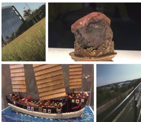
故宮南院 內容與心得

我們去安平的第一件事情當然是去逛街囉，我們不但去了安平古堡、劍獅埕，還去買了一些餛飩，那裡的餛飩很好吃😊。古堡裡面還有一些古蹟。