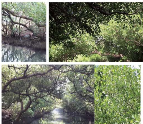
台江國家公園 心得報告