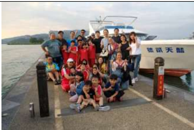
日月潭-水域環境介紹體驗