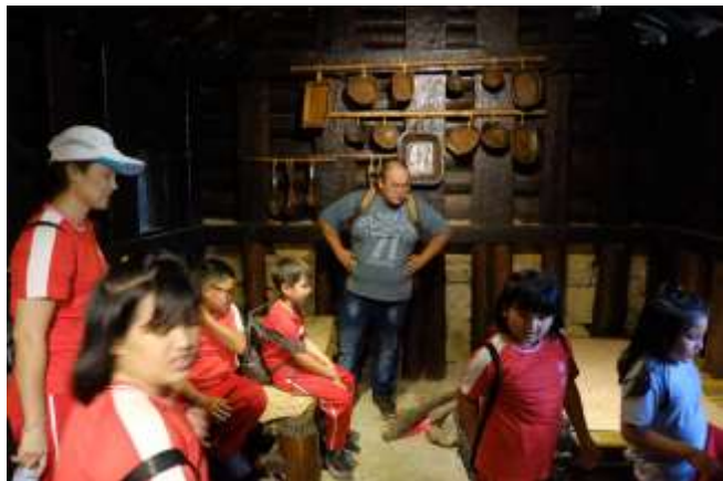
九族文化村-泰雅半穴居