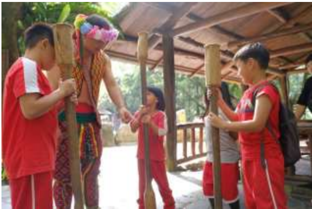
九族文化村-杵音學習