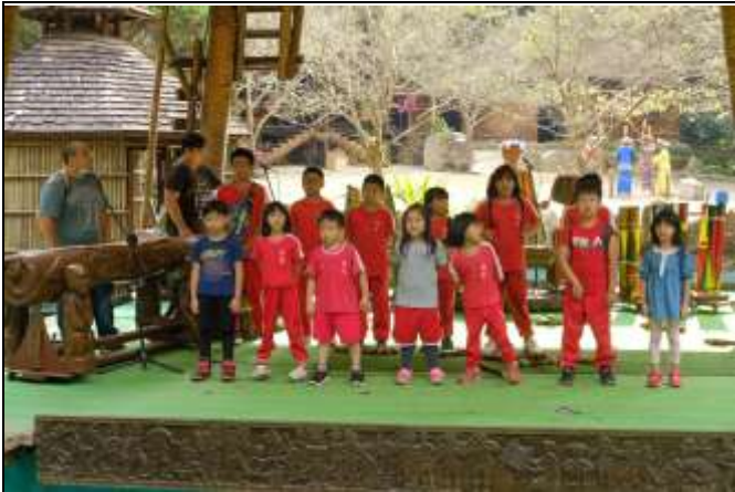
九族文化村-學生上台LIVE秀