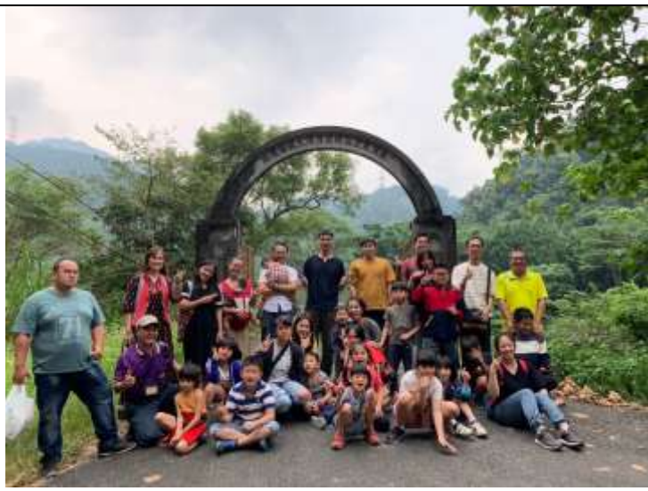
大觀發電廠-環境及發電原理介紹