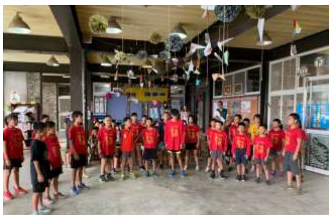
潭南國小-歌謠展演