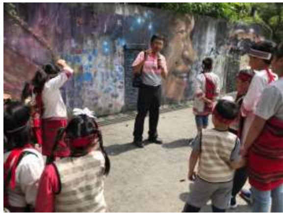
潭南國小-壁畫解說