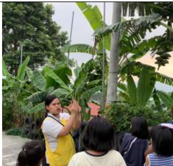
集元果觀光工場-香蕉種類介紹