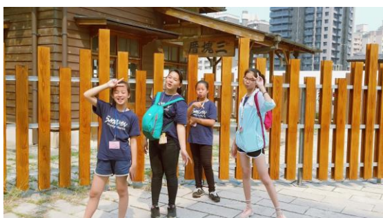
分組自主行程-尋找古蹟