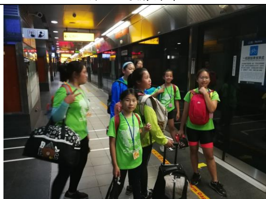
分組搭捷運進飯店