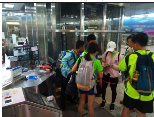
問題解決:遺失票卡處理