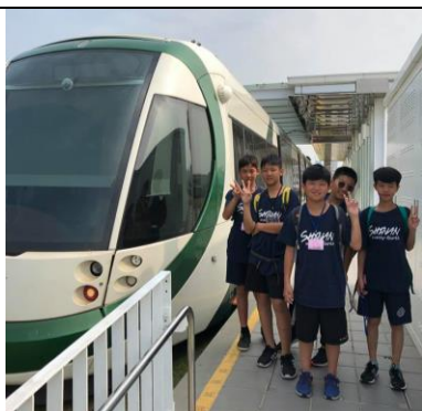
分組自主行程-搭輕軌