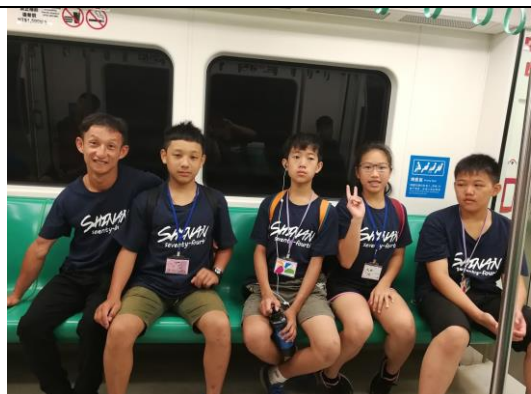
分組自主行程-搭捷運