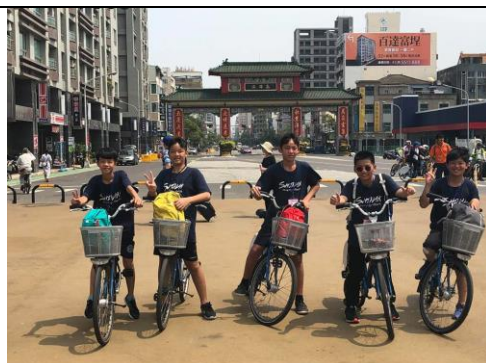
分組自主行程-租公共單車