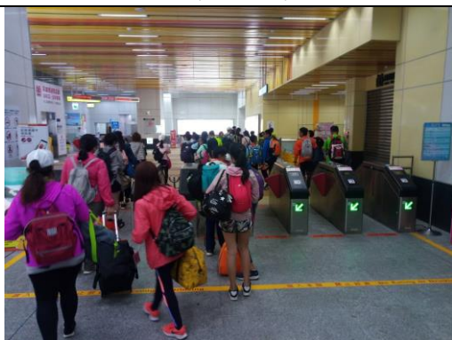
轉搭捷運-挑戰開始