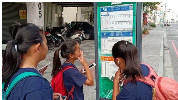
分組自主行程-搭公車