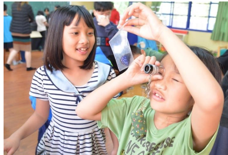
左圖為運用大富翁遊戲，讓加深小朋友的生態印象。右為都達國小學童認真觀察蝴蝶標本。