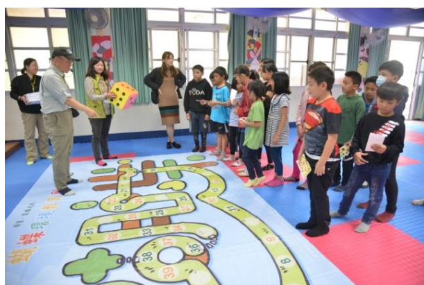
左圖為運用大富翁遊戲，讓加深小朋友的生態印象。右為都達國小學童認真觀察蝴蝶標本。