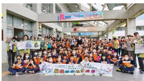
左圖為中峰國小右圖為南豐國小蝴蝶環境教育列車參與師生與解說員合影。