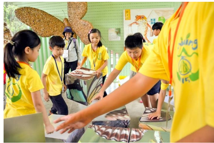
發揮合作的蝴蝶拼拼樂闖關遊戲。