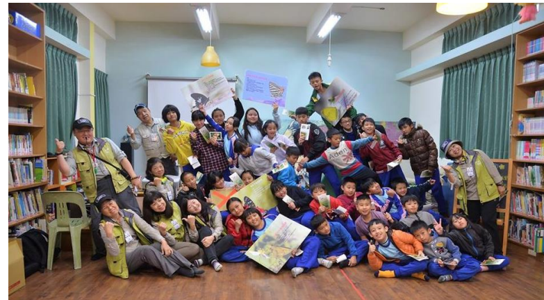
左圖為中峰國小右圖為南豐國小蝴蝶環境教育列車參與師生與解說員合影。