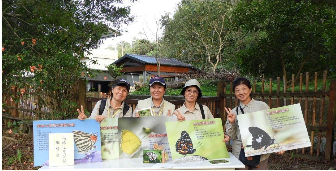
30 位蝴蝶生態解說員，是環境教育的重要推手。