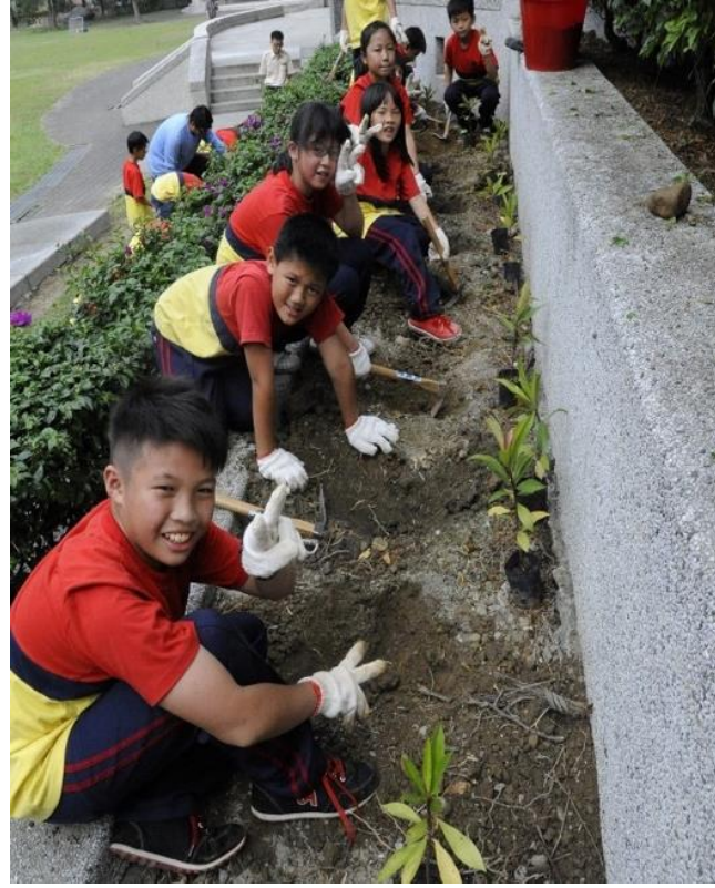
左圖為蝴蝶拼拼樂闖關遊戲。右為導入蝴蝶棲地營造。