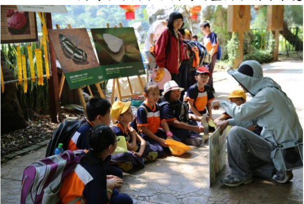
左圖為認識蝴蝶五大科。右為蝴蝶棲地營造。