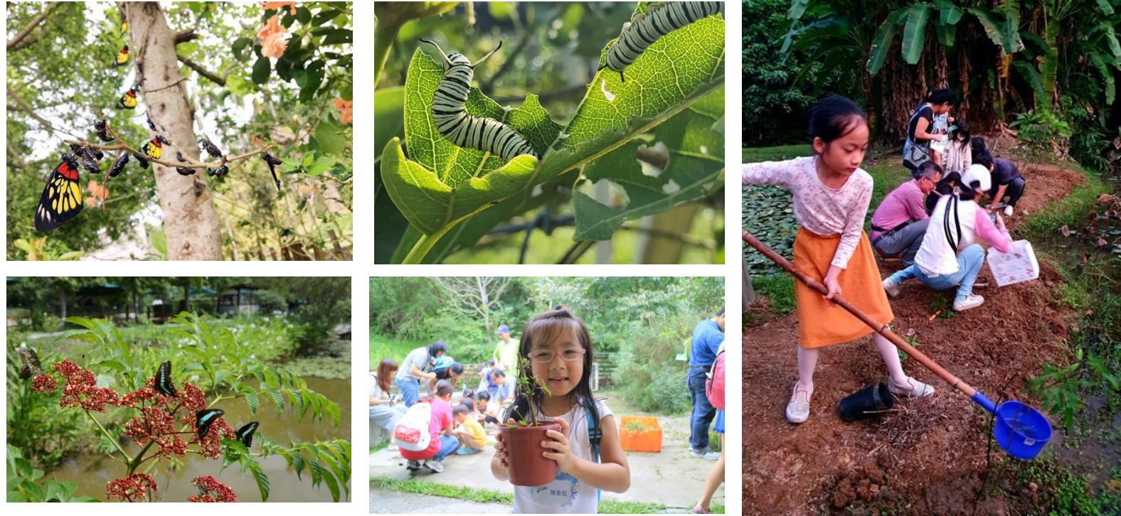
紙教堂園區內廣植食草和蜜源植物，常見毛毛蟲和蝴蝶蹤影。透過棲地的營造，讓孩子成為守護環境的小推手。很好的生態教室。

可以根據學校的餐標訂製便當/漢堡，食材以採用紙教堂自然農園蔬果為主，讓孩子吃的安心又健康！