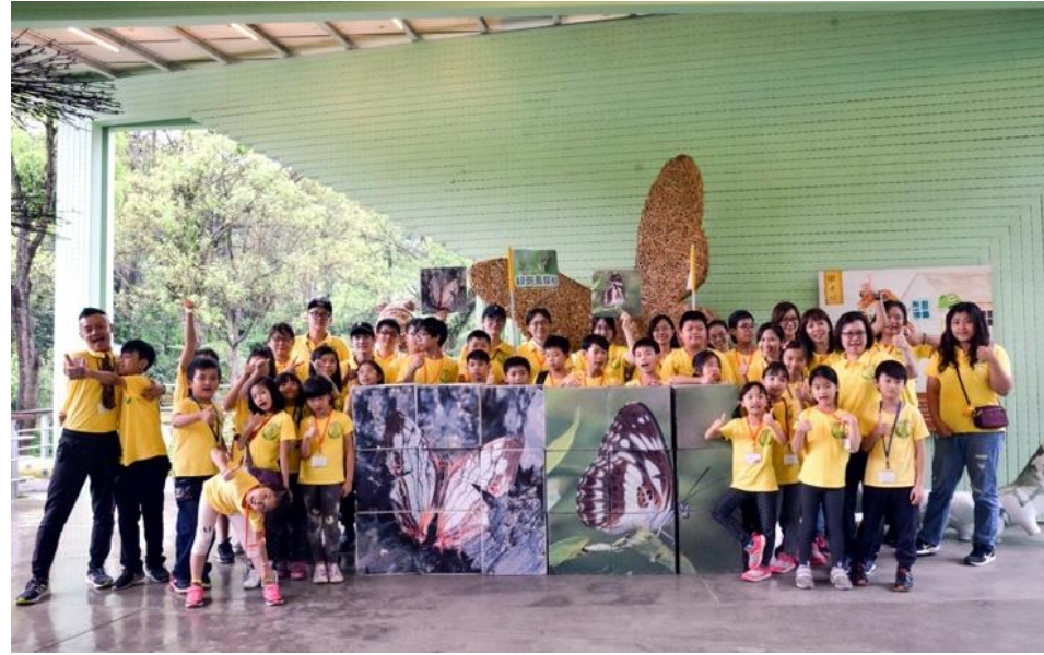
左圖為蝴蝶拼拼樂闖關遊戲。右為導入蝴蝶棲地營造。