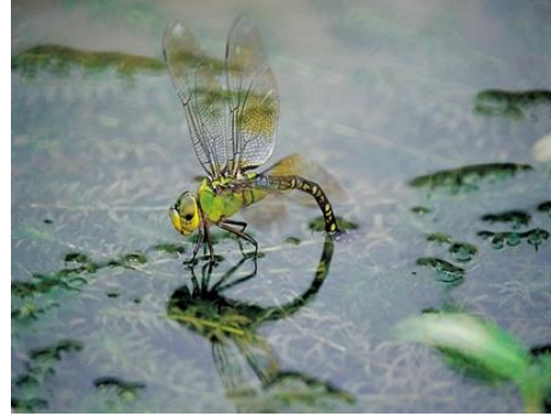
紙教堂及其週遭擁有 15 座大小生態濕地，見證生物多樣性之美。