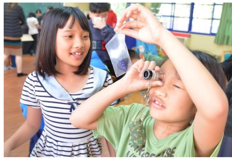
左圖為運用大富翁遊戲，讓加深小朋友的生態印象。右為都達國小學童認真觀察蝴蝶標本。