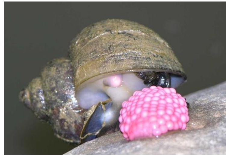
KO 阿福活動，讓孩子們認識濕地的維護管理及外來入侵種對環境的危害。