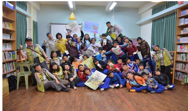
左圖為中峰國小右圖為南豐國小蝴蝶環境教育列車參與師生與解說員合影。