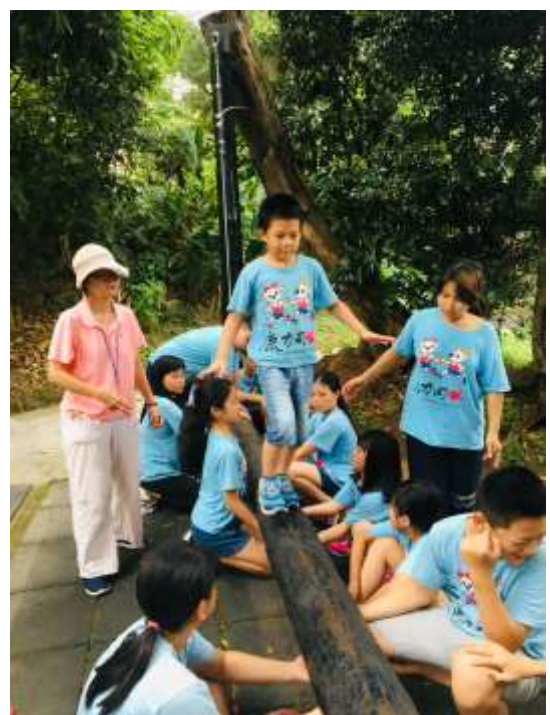
【我們會為你扶穩未來的道路】