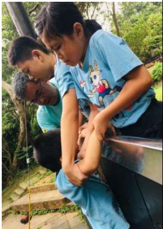
【太棒了！你成功爬上來了！】