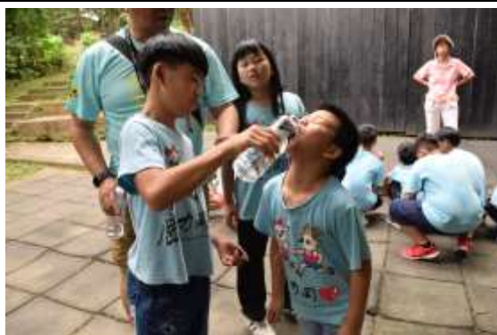
【六年級哥哥餵一年級喝水】