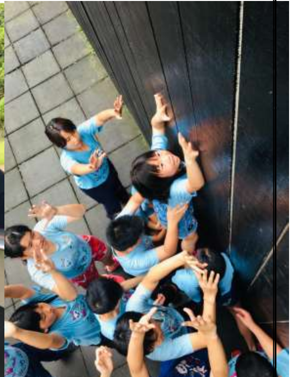
【你勇敢挑戰，我們會保護你的！】