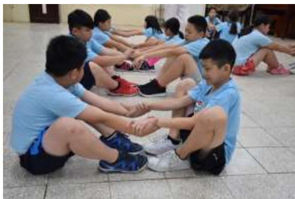
【團隊默契練習暖身】