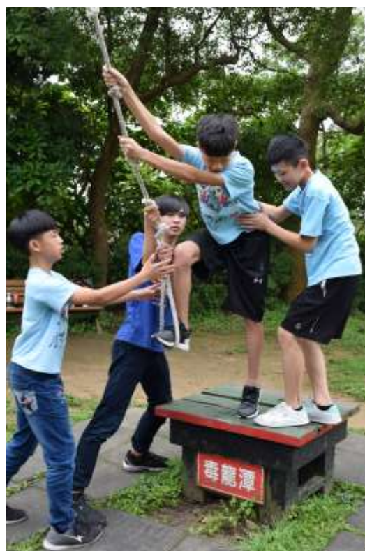
【團結合作互相扶持】