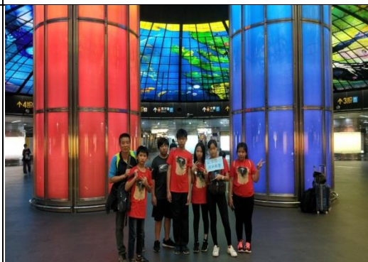
高雄美麗島捷運站—光之穹頂