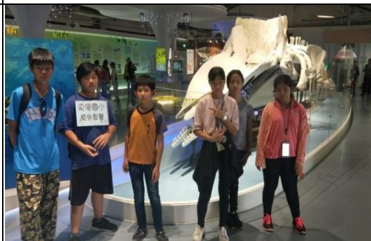
北門鹽業中心—抹香鯨標本區