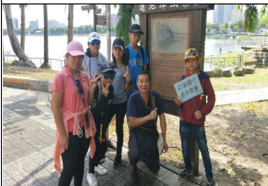
高雄鳳山舊城探訪