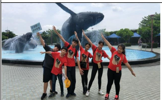
國立海洋生態博物館