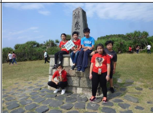
參觀鵝鑾鼻燈塔風景區