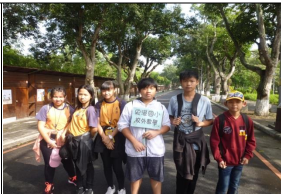
參訪古坑綠色隧道