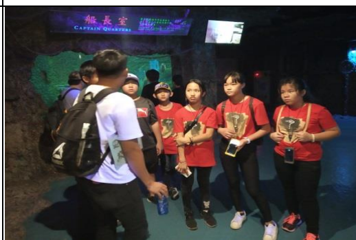
國立海洋生態博物館探索海洋世界