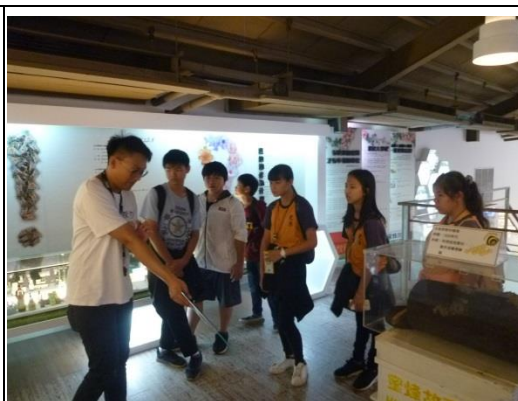
蜜蜂故事館---對蜜蜂的了解