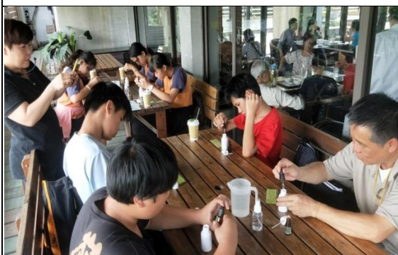
薰之園生態農場---動手DIY