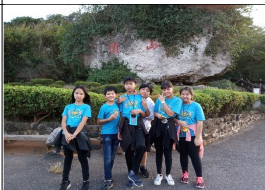
關山探索夕陽成因及欣賞日落美景