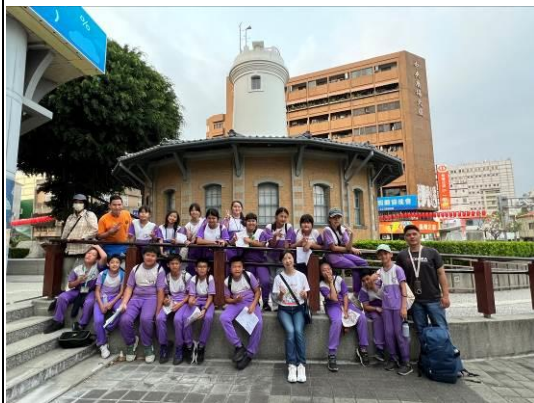
日據時期的氣象局