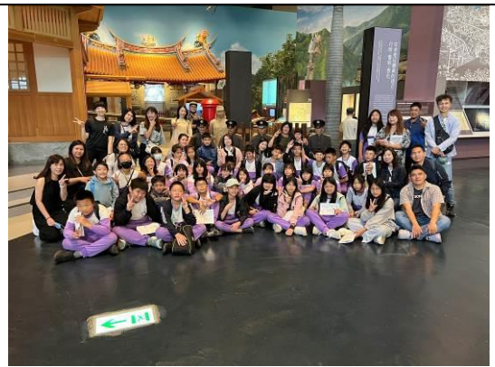
台灣歷史博物館留影