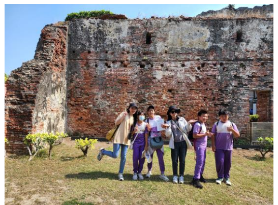
安平古堡當年戍守海疆的斑駁城牆