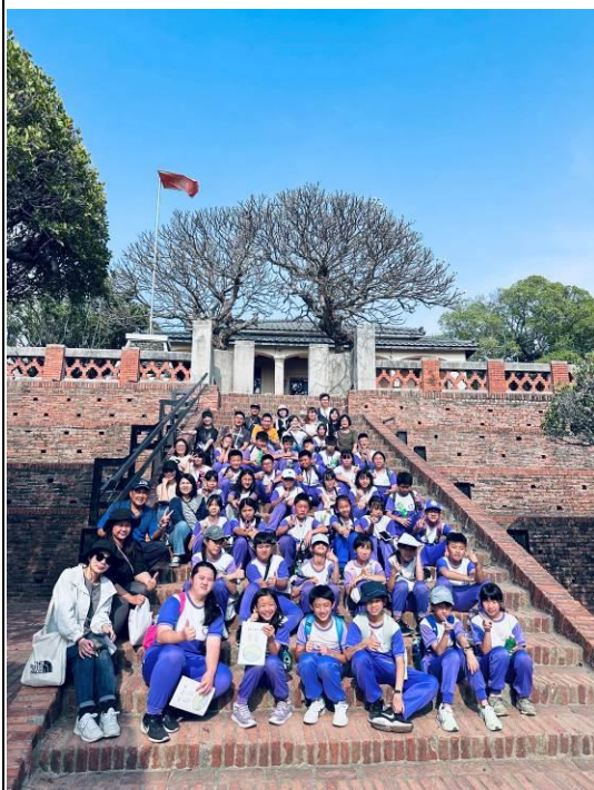
安平古堡內大合照