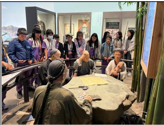
參觀台灣歷史博物館