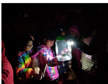
說明：分辨莫氏樹蛙的雄雌