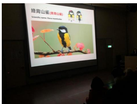
說明：晨間賞鳥行前介紹