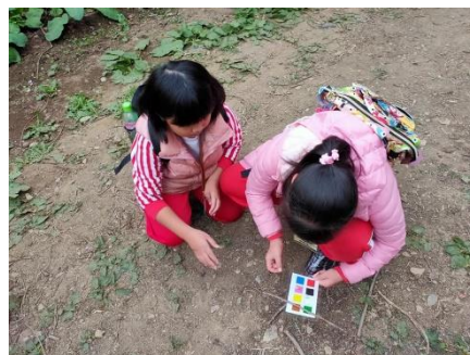
說明：在大自然裡進行顏色尋寶