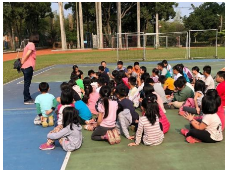
說明：老師進行省思與分享