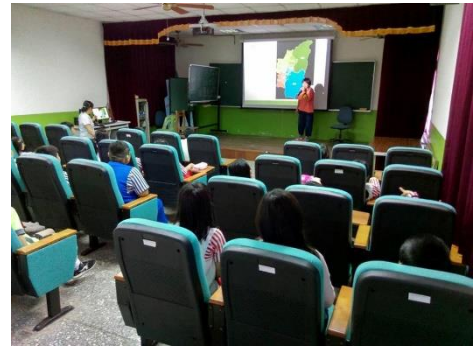
說明：認識梅峰農場的地理位置