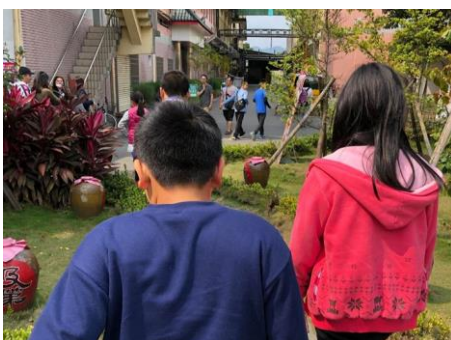
說明：學生欣賞布置的酒甕