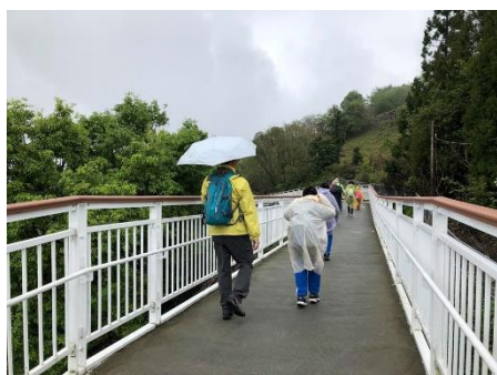
說明：沿途觀賞步道兩旁生物