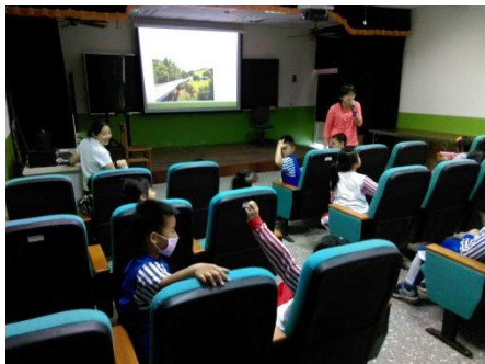
說明：認識清境的空中步道