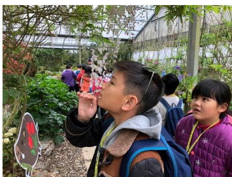
說明：忍不住聞聞紫藤花的香氣