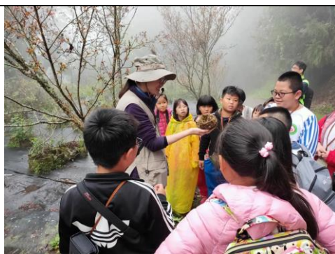
說明：認識鳥巢的構造