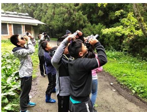
說明：觀察山桐子上面的白耳畫眉