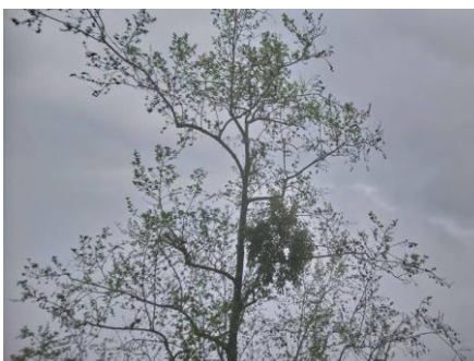
說明：觀察大樹上的寄生植物