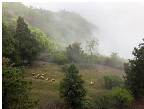
說明：欣賞綿羊覓食