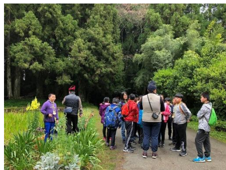
說明：溫帶花卉區介紹