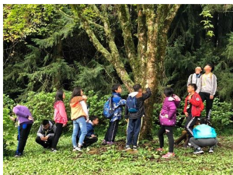
說明：認真觀察的小朋友