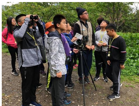
說明：觀察赤腹松鼠與條紋松鼠