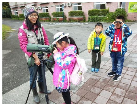
說明：練習使用單筒望遠鏡