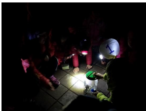
說明：觀察盤古蟾蜍的耳後腺