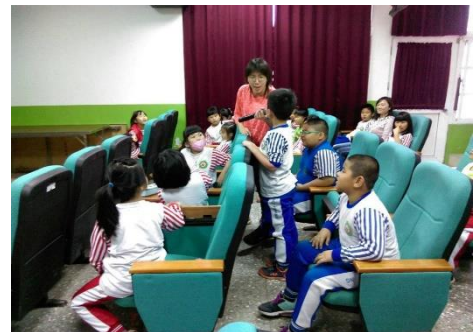
說明：學生提問與分享