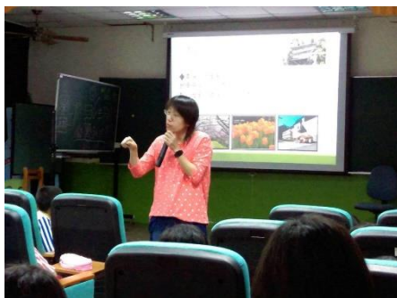
說明：認識梅峰農場的經營策略