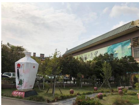
說明：參觀埔里酒廠