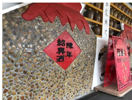
說明：準備認識埔里的特產