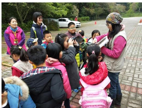
說明：認識賞鳥的工具-鳥類圖鑑