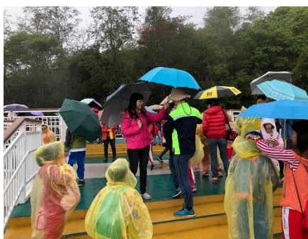
說明：景觀臺上小憩