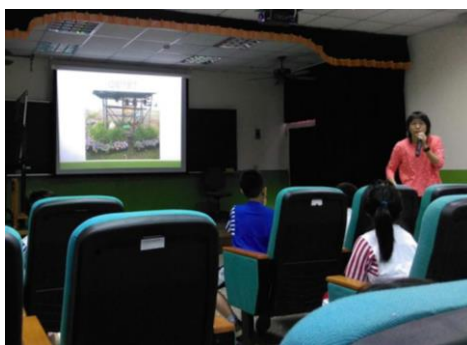
說明：認識梅峰農場的生態農法