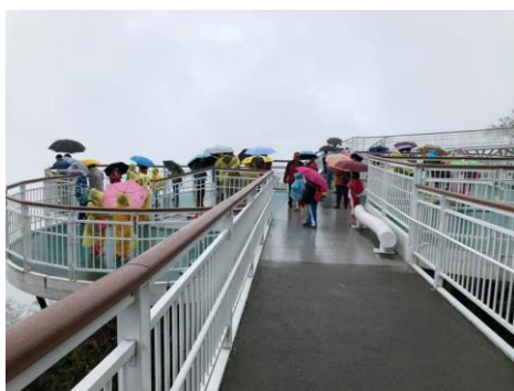
說明：看腳底下的草坡與綿羊