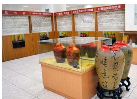
說明：認識埔里的地方特產紹興酒