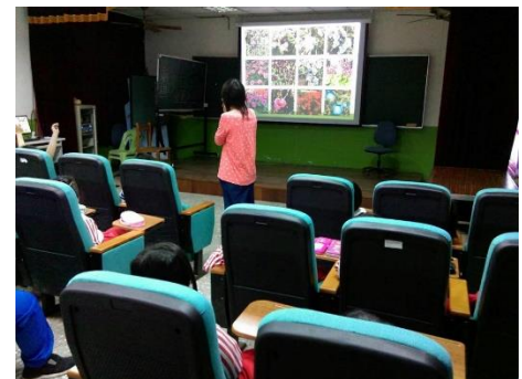
說明：認識梅峰農場的植物與動物