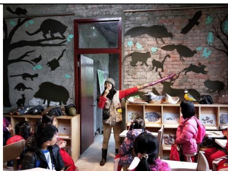
說明：認識梅峰農場常見的動物