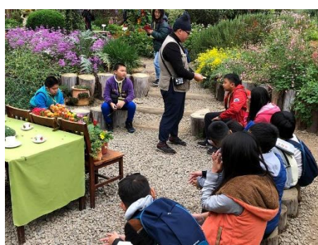
說明：有獎徵答發獎囉