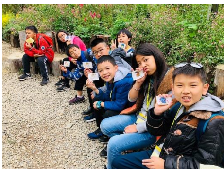
說明：獲得可愛的鳥圖貼紙