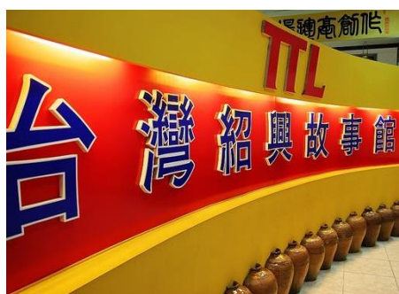
說明：參觀紹興酒故事館