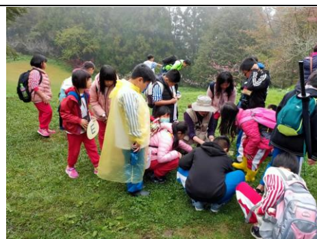
說明：觀察草地上的植物