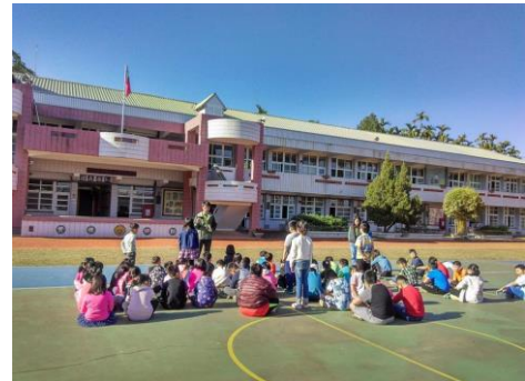
說明：老師進行省思與分享