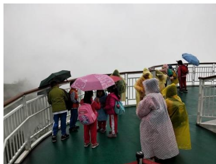
說明：師生細雨中欣賞山景