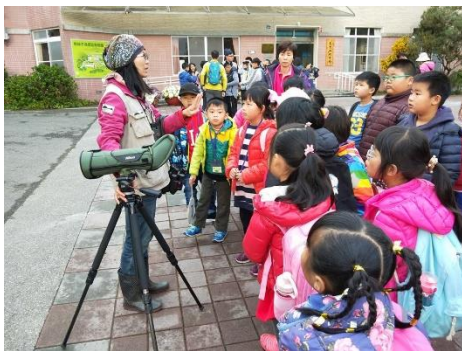
說明：解說員說明賞鳥應有的態度