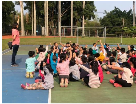
說明：老師進行省思與分享