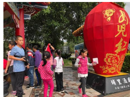
說明：欣賞埔里酒廠布置的酒器