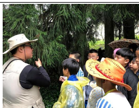
說明：分辨日本柳杉與臺灣杉