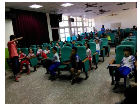
說明：學生常規與安全指導