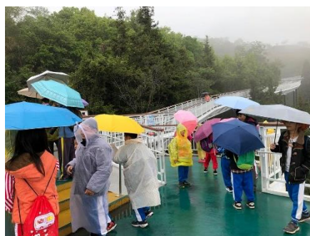
說明：霧中體驗步道的另一種美