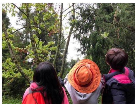
說明：觀察黃腹琉璃覓食