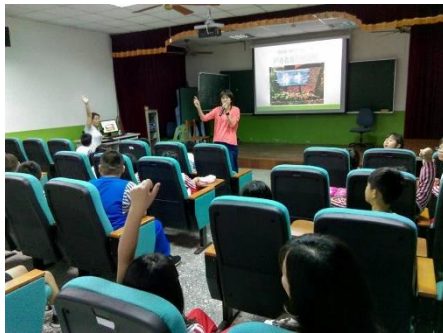
說明：老師說明戶外教育相關注意事項