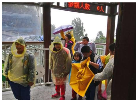
說明：驗票進入清境高空步道