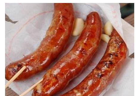
說明：品嚐美味的香腸