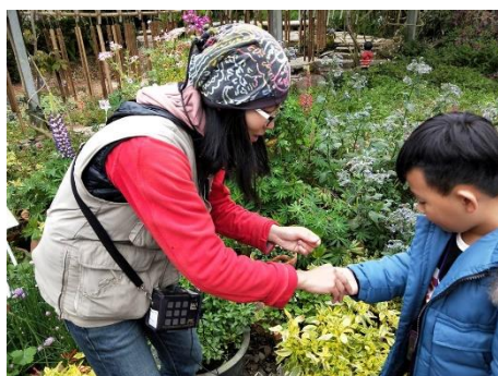
說明：運用五觀觀察植物的特徵