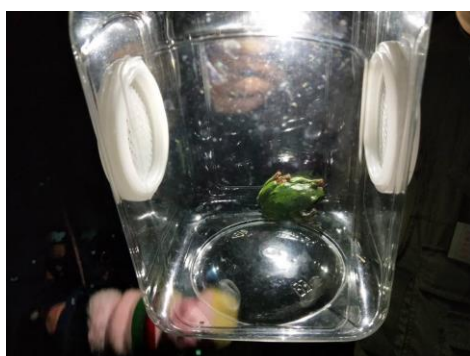
說明：認識莫氏樹蛙的型態