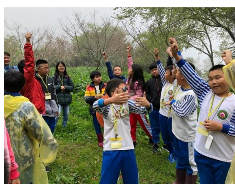
說明：猜猜我是哪種動物？