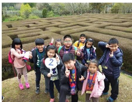
說明：綠籬迷宮大挑戰