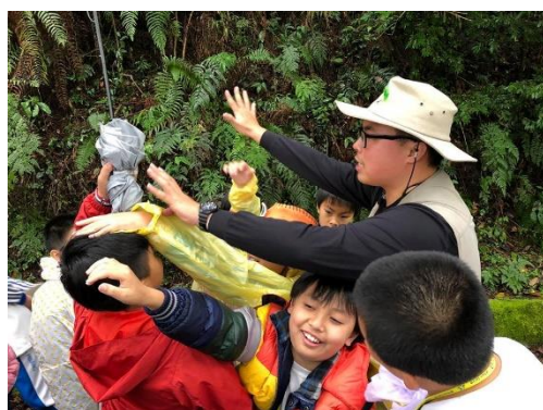
說明：扮演樹葉為取得陽光的生長機制