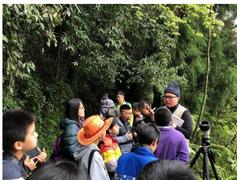
說明：認識鳥類與植物的關係