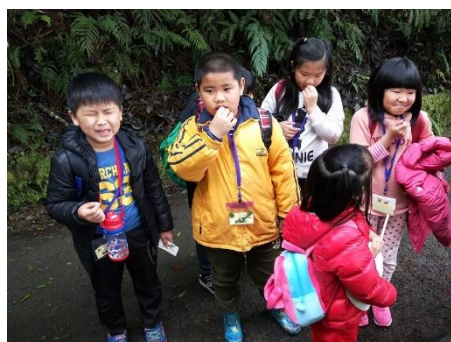
說明：嚐嚐植物的酸甜苦辣