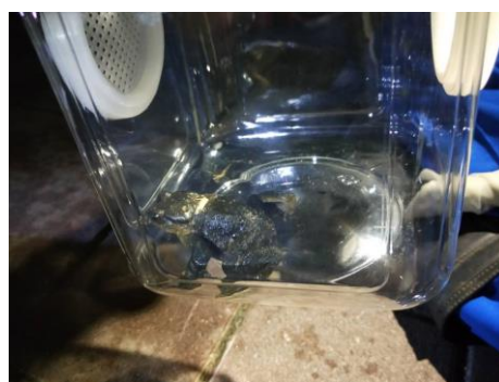
說明：認識盤古蟾蜍的型態