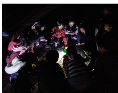
說明：觀察盤古蟾蜍的腳趾有幾個