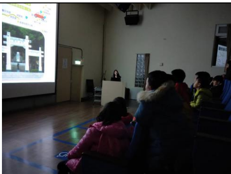
說明：梅峰四季簡報