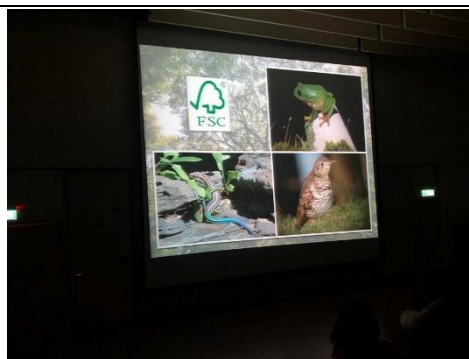
說明：認識梅峰的動物資源