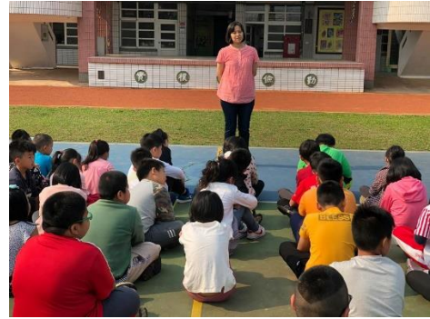
說明：老師進行省思與分享