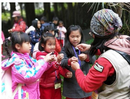
說明：用二葉松的葉子來拔河