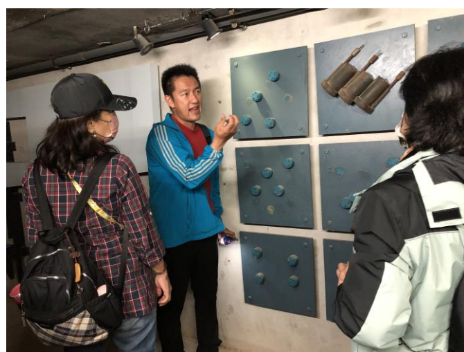
地雷展示館~模擬地雷並體驗戰地風情