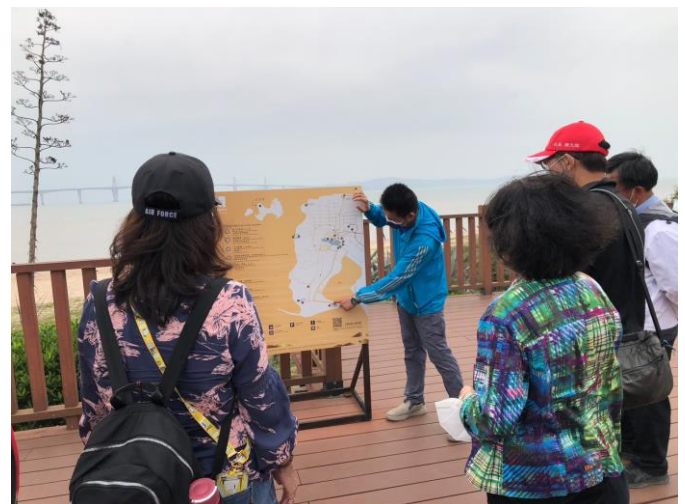
慈堤三角堡文史參訪