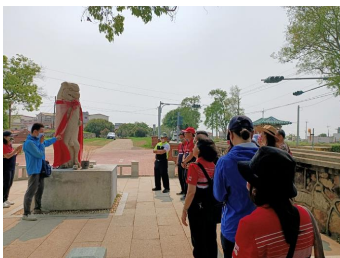
風獅爺的奇蹟與傳說