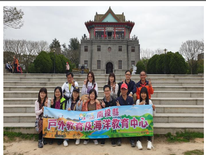
莒光樓文史導覽參訪