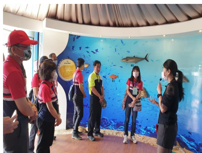
水產試驗所參訪~了解鰲的生態