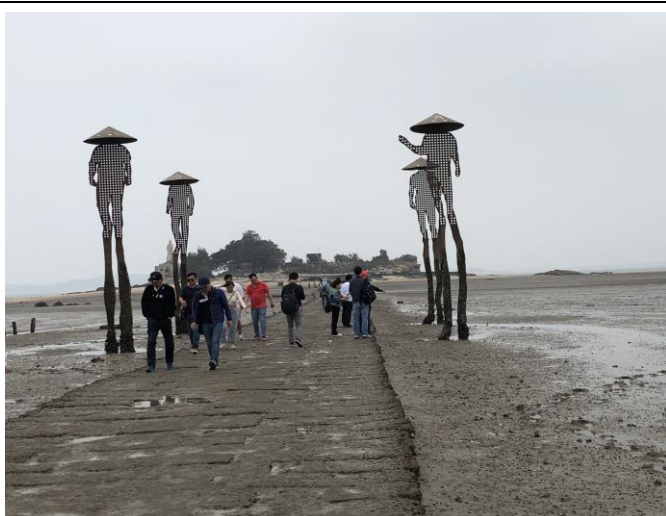
建功嶼~見證摩西分海的奇幻時刻