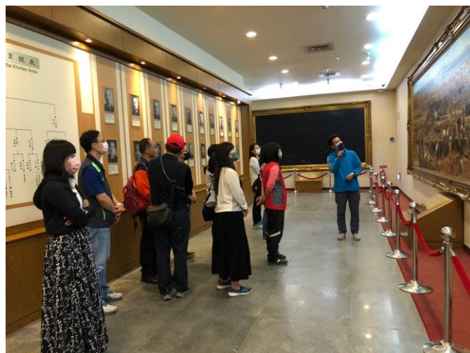
古寧頭文史館參訪