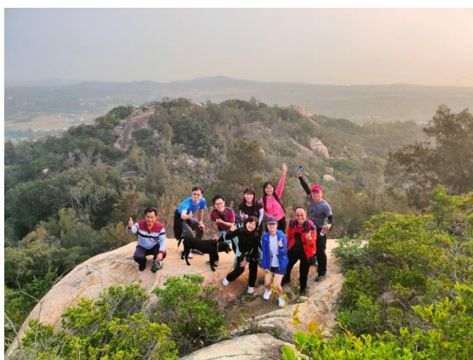
晨訪太武山~由高空俯瞰金門美景