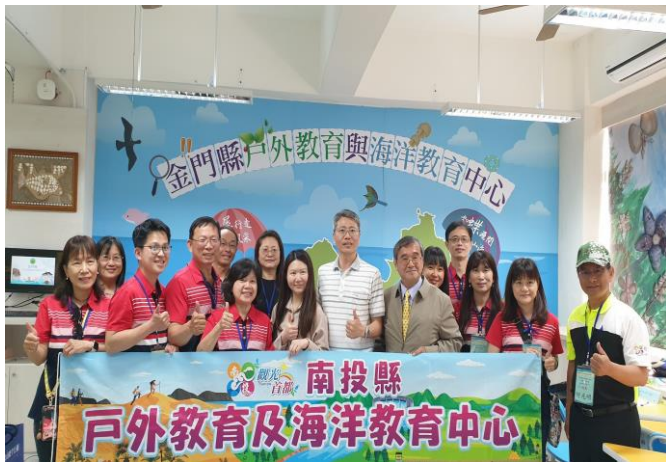
與金門縣戶外教育與海洋教育中心交流