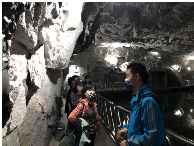
翟山坑道~見證半世紀的軍事藝術