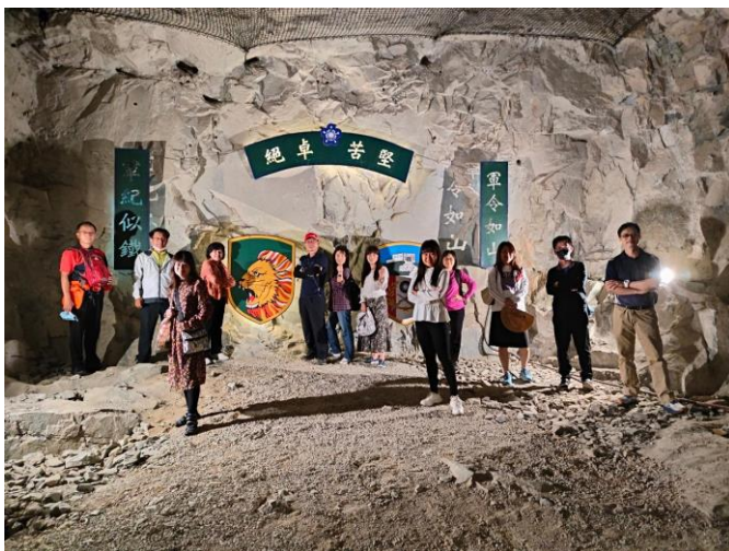
九宮坑道文史導覽參訪