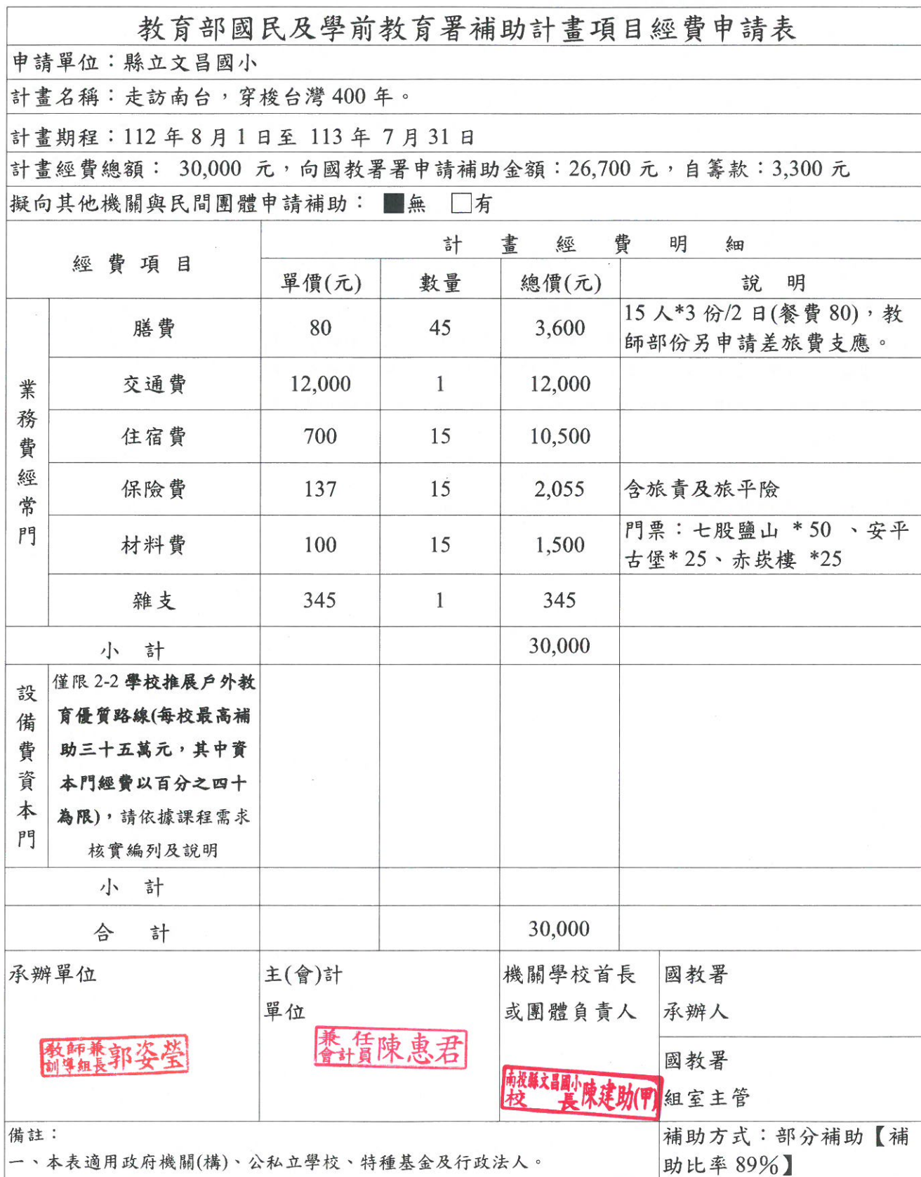
表 4 計畫二、辦理戶外教育課程經費申請表-學校填列提報