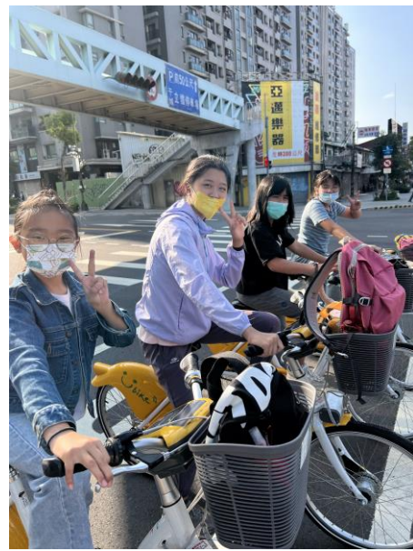
台南安平古堡探索