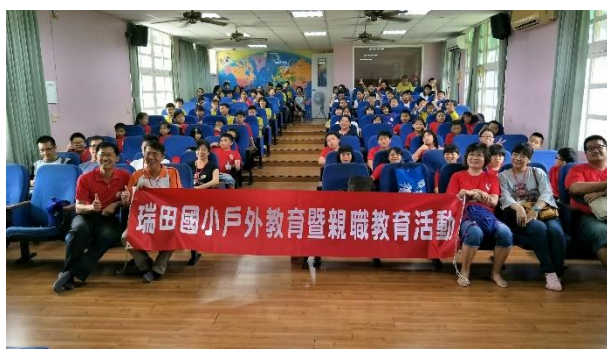
參訪新岑國小大合照