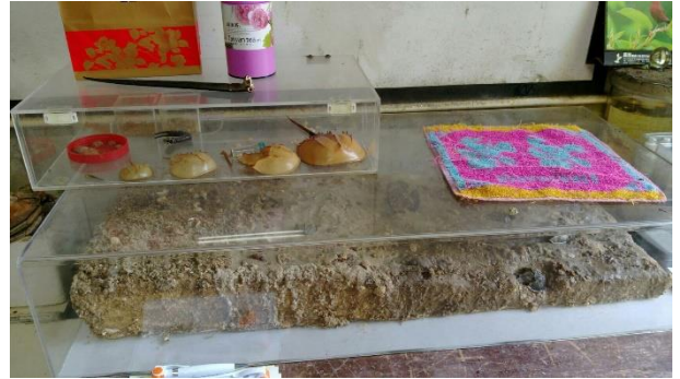
新岑國小鸞復育參訪 2