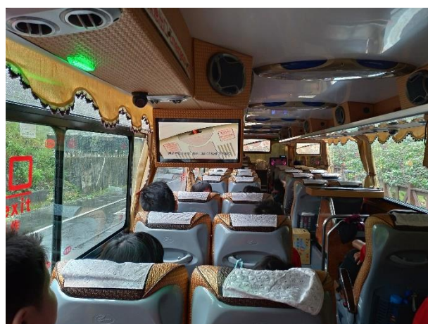
觀看車上安全影片宣導