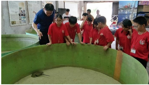
新岑國小鸞復育參訪 1