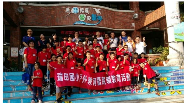
參訪新岑國小拍照紀念