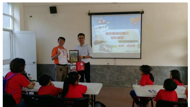
與新岑國小互贈伴手禮